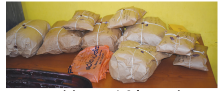
யாழ்ப்பாணத்தில் இருந்து கொழும்புக்குக் கடத்தப்பட்ட 8 பக்கம் 03 >>>