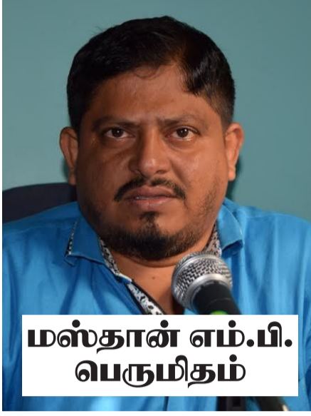
மஸ்தான் எம்.பி. பெருமிதம்

மேலும், இதுவே இந்தப் பகுதியில் முதன் முதலாக ஸ்ரீலங்கா சுதந்திரக்