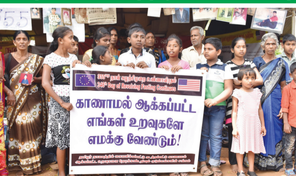
வவுனியா, பெப்.14 சர்வதேசத்தின் வருகையே எமது உறவுகளின் மீள் வருகையை உறுதிப்படுத்தும். காணாமல் ஆக்க பக்கம் 18 >>>