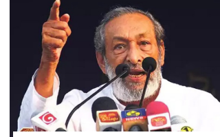
வாசுதேவ நாணயக்கார தெரிவிப்பு

காபந்து அரசு ஒன்றை உருவாக்க வேண்டும் என நாடாளுமன்ற உறுப்பினர் வாசுதேவ நாணயக்கார தெரிவித்துள்ளார். நாடாளுமன்றம் உடனடியாகக் கலைக்கப்பட்டு தேர்தல் நடத்தப்பட வேண்டும் எனவும் அவர் கோரிக்கை விடுத்துள்ளார். இது தொடர்பில் அவர் மேலும் தெரிவிக்கையில் - மூன்றில் இரண்டு பெரும் பான்மைப் பலத்துடன் நாடாளுமன்றைக் கலைப்பது குறித்து ஏனைய கட்சிகளுடன் பேச்சு நடத்தத் தயார். ஐக்கிய தேசியக் கட்சிக்கு எதிரான தரப்புக்களுடன் இணைந்து நாடாளுமன்றைக் கலைத்து தேர்தல் நடத்துவதற்கான முயற்சிகள்