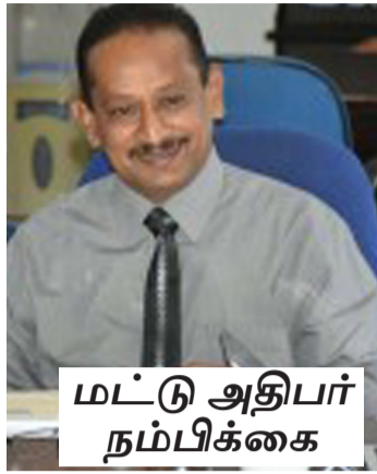
மட்டு அதிபர் நம்பிக்கை

தெரிவித்தார். அவர் மேலும் தெரிவித்தவை வருமாறு - ஆஸ்திரேலிய உதவித்திட்டத்தின் - உள்வாங்கப்பட்ட வளர்ச்சிக்கான திறன்கள் அபிவிருத்தித் திட்டத்தில் மட்டக்களப்பு மாவட்டம் உள்வாங்கப்பட்டதையிட்டு மகிழ்ச்சியடைவதுடன், மட்டக்களப்பு மாவட்டத்தில் போரால் பாதிக்கப்பட்ட முன்னாள் போராளிகள், தொழிலுக்காக போராடிக்கொண்டிருக்கின்ற இளைஞர்கள் தொழில்துறைத் திறன்களுடன் காணப்படுகின்றனர். வரலாற்று ரீதியான, பாரம்பரியமான பிரதேசங்கள் பல வற்றை மட்டக்களப்பு மாவட்டம்