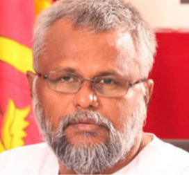
பெற்ற கட்சியினர் ஆட்சியமைத்து மக்கள் நலன்சார் பக்கம் 03 >>>

(எஸ்.நிதர்ஷன்) யாழ்ப்பாணம், பெப்.14 வடக்கில் உள்ள சில உள்ளூராட்சிச் சபைகளில் ஆட்சியமைப்பதில் தொங்கு நிலை ஏற்பட்டுள்ளது. பெரும்பான்மை