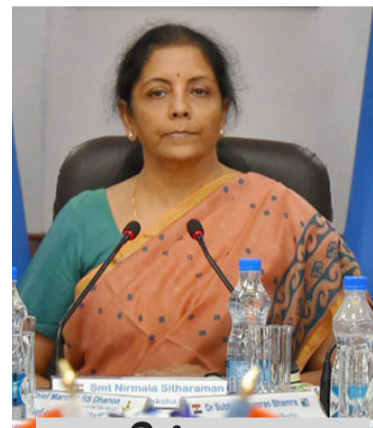
நிர்மலா சீதாராமன் எச்சரிக்கை

இந்த நிலையில் பயங்கரவாதத் தாக்குதல் தொடர்பாக மத்திய பாதுகாப்புத்துறை அமைச்சர் நிர்மலா