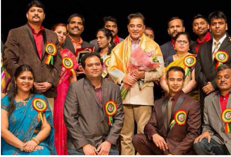
வந்து இருக்கிறேன். அதே நேரம் நாட்டுக்காக ஒதுக்க போல் நீங்களும் கொஞ்ச வேண்டும். நான் வெறும்

நான் என் வேலைகளை விட்டு விட்டுக் கடமை செய்ய