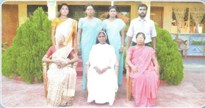
பழைய மாணவர் சங்க உறுப்பினர்கள்