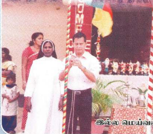
இல்ல மெய்வல்லுனர் போட்டிகளில்