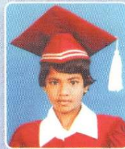
ம.நிலக்ஷிகா (142 புள்ளிகள்)