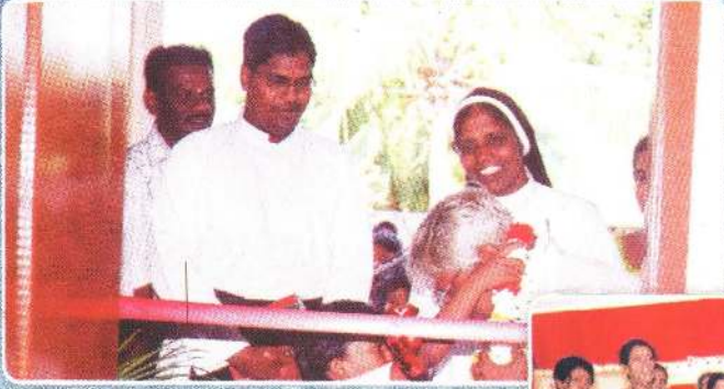
புதிய அலுவலகத் திறப்பு விழா