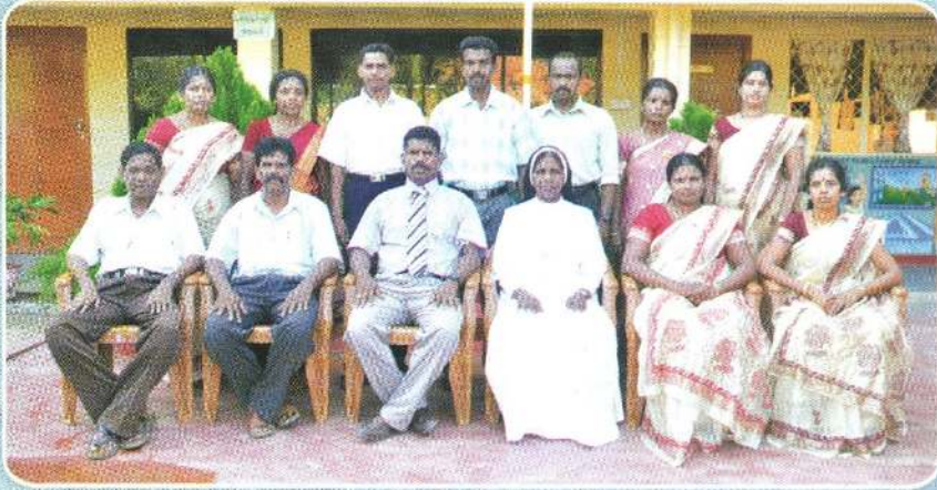
பாடசாலை அபிவிருத்திச் சங்க உறுப்பினர்கள்