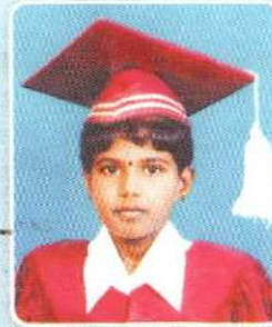
ஜெ.மயூரிக்கா (148 புள்ளிகள்)