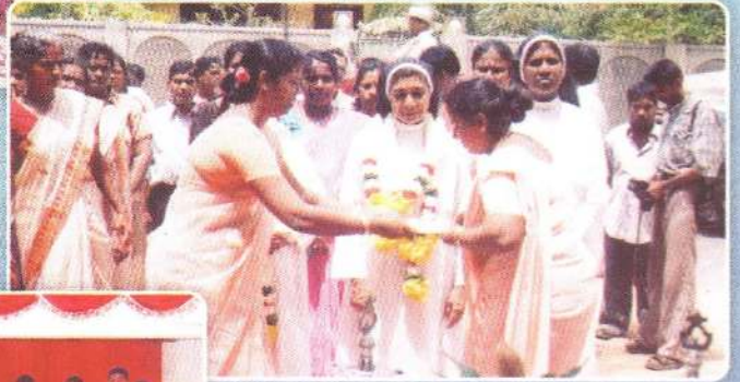
அப்போஸ்தலிக்க கார்மல் சபை மாகாணத்தலைவி அவர்களை வரவேற்கும் போது...