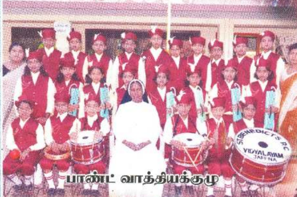
பாண்ட வாத் தயக்குழு