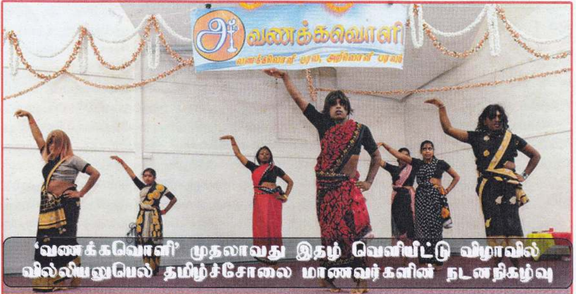
'வணக்கவொளி' முதலாவது இதழ் வெளியீட்டு விழாவில் வில்லியலுபெல் தமிழ்ச்சோலை மாணவர்களின் நடனநிகழ்வு