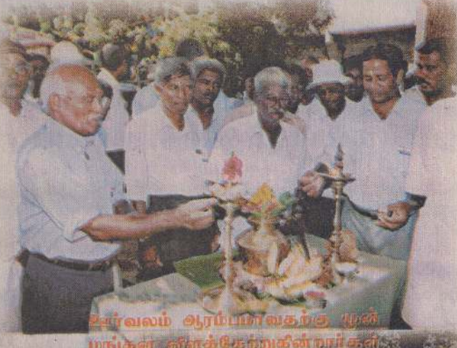
உணர்வுகூட்டி அரம்பாட்டிற்கு முன் மாணவர்கள் விளக்கேற்றுகின்றார்கள்