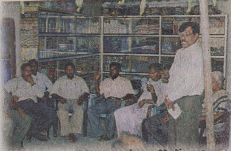
உணர்வுகூட்டி ப.நோ.கூ.சங்க யாழ் விழுவை தலைவரின் தர்ப்பு விழாவில் கலந்துகொண்ட பிரமுகர்கள்