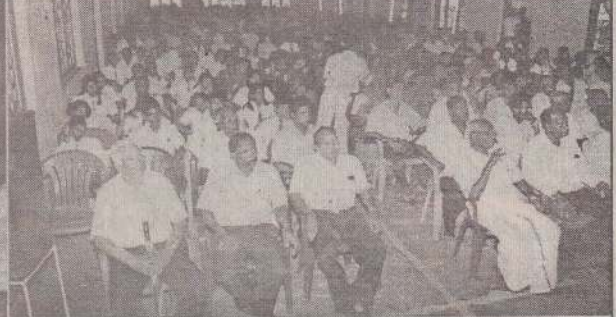
கிராமநாதன் மகளிர் கல்லூரியில் நடைபெற்ற 88 ஆவது சர்வதேச கூட்டுறவு தின விழாவில் விருந்தினர்கள் உரையாற்றுவதையும் விழாவில் கலந்துகொண்டவர்களையும் காணலாம்.