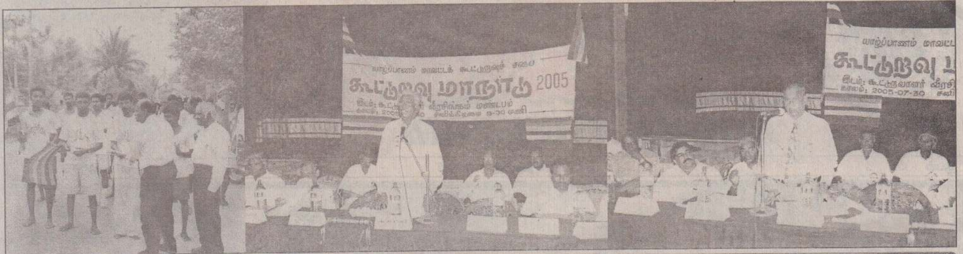
கூட்டுறவு செய்தி கொண்டு செல்லும் மரதன் அணியின் ஆயத்த நிலையில்....