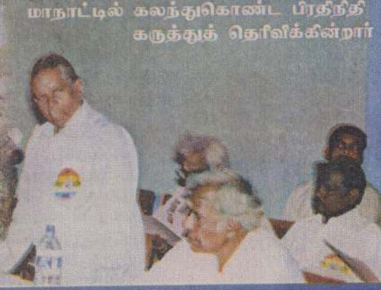
மாநாட்டில் கலந்துகொண்ட பிரதிநிதிகளுக்குத் தெரிவிக்கின்றார்