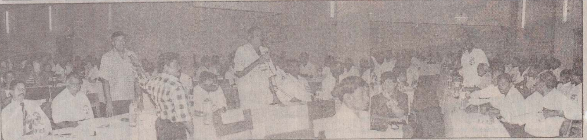
கூட்டுறவு மாநாட்டில் கலந்து கொண்ட பிரதேசிகள் உரையாற்றுவதையும் மாநாட்டில் கலந்துகொண்ட பிரதேசிகளையும் படத்தில் காணலாம்

மாண்புமிகு உறுப்பினர் கருத்துக்கள் கூட்டுறவுச் சங்க முன்னிலை திருந்து ஆற்றலான