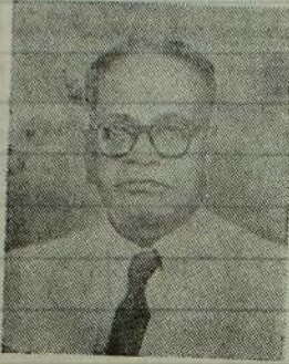
ஆர். பி. சேதுப்பிள்ளை

மனத்தின்மையே வரலாற்றின்மையாகும் மனத்தின்மை அற்றவர்கள் ஒரு சொன்னையில் நிலைத்து நிற்கமுடையவர்கள். மன உறுதியுடையவர்கள் மலைபோல் உடையாது நிற்பார்கள். அவர் மெய் வகுக்கும் பாரார் பரி நோக்கார் அருமையும் பாரார் அவமதிப்பும் கொள்ளார். மனவறுதி கொண்டு அறநெறியில் நிற்கும் மாந்தரை இவ்வகை மோற்றம். "அரிச்சந்திரன் வாய்மையே எனும் சத்திய நெறியில் வழுவாது தின்றான் பாவகையான சோதனைக்கு உட்பட்டான் பதியிழந்தான் பாலவையிழந்தான் பட்டறிதி இழந்தான் இவ்வாறு ஒன்றன்பின் ஒன்றாக எல்லாவற்றையும் இழந்து சனத்தொழில் புரியும் காலத்தும் சத்தியத்தை விடாது பற்றி தின்றான் தன்னைச் சோதித்த முனிவரை நோக்கி