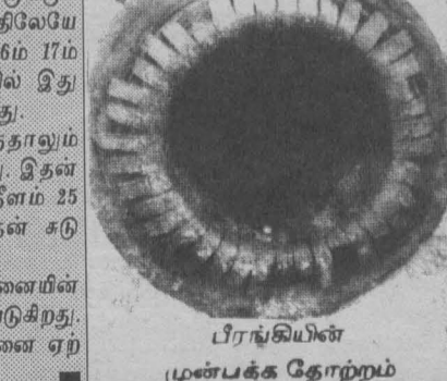
பீரங்கியின் முன்பக்க தோற்றம்

தற்போது நவீன பிரங்கிகள் போர்க் களங்களில் குண்டுகளை துப்பிக்கொண்டிருக்கின்றன. முதன்முதலில் பீரங்கிகளை கண்டு பிடித்து போருக்கு பயன்படுத்தியவர்கள் ரோமர்கள் என்று தகவல். படத்தில் இருப்பது தமிழ்நாட்டில் தஞ்சாவூரில் இருக்கும் பீரங்கி. சாதாரண பீரங்கியல்ல. இராட்சதப் பீரங்கி. படத்திலேயே இந்தப் பிரமாண்டம் எனில், நேரில் எப்படியிருக்கும்? 16ம் 17ம் நூற்றாண்டில் இது தயாரிக்கப்பட்டது. அந்தக் காலத்தில் இது குரப்பீரங்கி. இப்போது கண்காட்சிப் பொருளாகிவிட்டது. தற்காலத்தில் நவீன பிரங்கிகள் ரகம் ரகமாக இருந்தாலும் இப்பீரங்கியைப் போன்ற இராட்சத பீரங்கிகள் கிடையாது. இதன் எடை 30 ஆயிரம் கிலோ! அதாவது 30 தொன்! இதன் நீளம் 25 அடி. 300 கிலோ எடையுள்ள குண்டை இது வீசும். இதன் சுருதுரம் ஆயிரம் அடி. இந்தப் பீரங்கியில் உள்ள இரும்பு வளையங்களை யானையின் உதவிகொண்டே தூக்கி மாட்டியிருப்பார்கள் என்று நம்பப்படுகிறது. மனிதனை மனிதன் அழிக்க அந்தக் காலத்தில்கூட எத்தனை ஏற்பாடுகள் பார்த்தீர்களா!