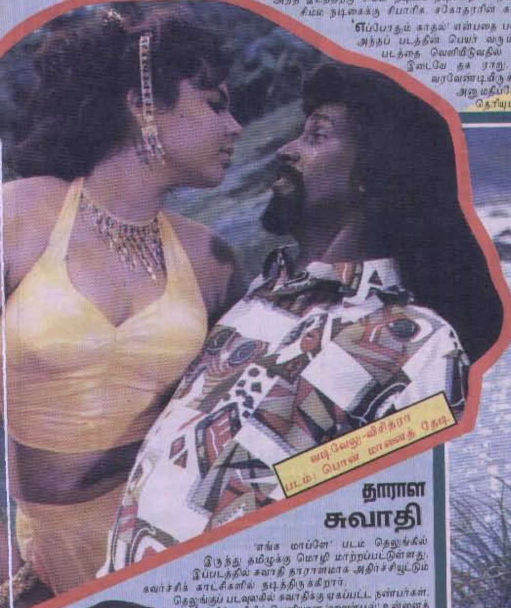
வடிவேலு-விசித்ரா படம்: பொன் மாணக் தேடி.

வையாபுரி பூர்ப்பு 'துள்ளாத மனமும் துள்ளும்' வெற்றி நடை போடுகிறது. நம்நாட்டிலும் விடியாக் கடைகளில் அப்படக் கொப்பிகளுக்கு பலத்த கிராக்கி. இப்படத்தில் அலி போன்ற தொற்றத்தில் நடித்துள்ளார் வையாபுரி. அதனால் இவரை பலரும் கேலி செய்கிறார்கள். உண்மையாகவே அலியாக இருக்குமோ என்று சந்தேகப் பட்டவர்களுக்கும் இதுக் கிராக்களாம். ஆனால் வையாபுரி கவலைப்படவில்லை. 'என் நடிப்பு எடுபட்டிருக்கிறது. பாத்திரத்தோடு கலந்து நடித்திருக்கிறேன். அதனால்தானே என்னை ஒரு அலி என்றே நம்பிக்கிறார்கள்' என்று பூரித்தப் போகிறார்.