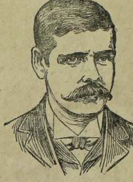
மெல்ஸ், ஈ. ஸ்பீர்மன் ஹியூஸ் எ. வி. எஸ். ஈ. கண்டி. இலங்கை.