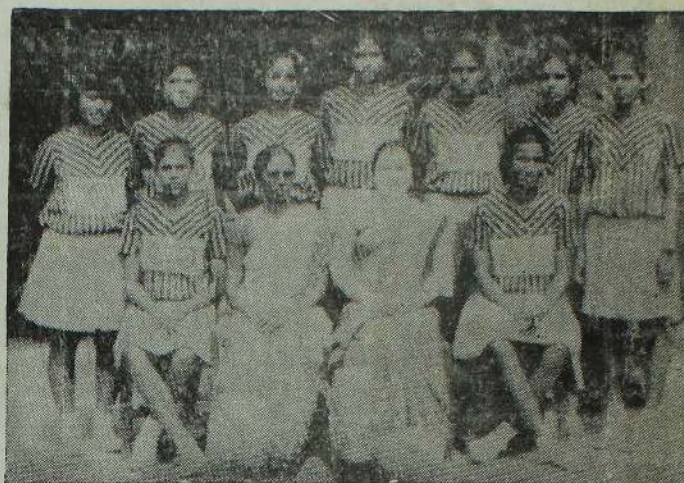
Uduvil Girls' College (u - 19) Team