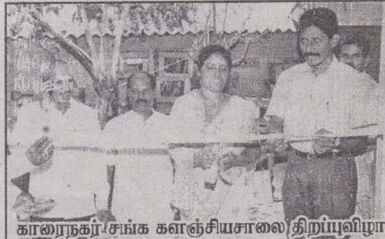
காரைநகர் சங்க களஞ்சியசாலை திறப்புவிழா