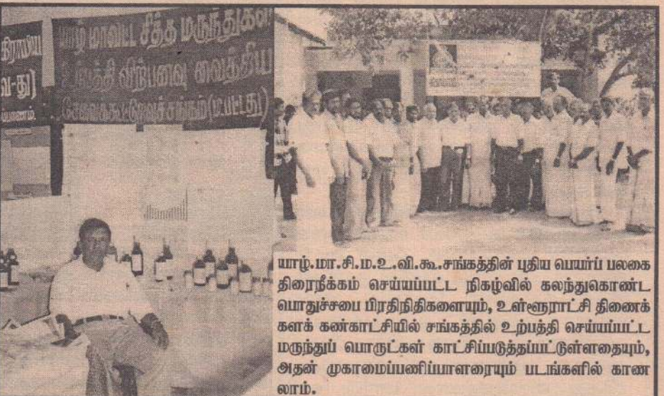
யாழ்.மா.சி.ம.உ.வி.கூ.சங்கத்தின் புதிய பெயர்ப் பலகை திரைநீக்கம் செய்யப்பட்ட நிகழ்வில் கலந்துகொண்ட யொதுச்சபை பிரதிநிதிகளையும், உள்ளூராட்சி திணைக்களக் கண்காட்சியில் சங்கத்தில் உற்பத்தி செய்யப்பட்ட மருந்துப் பொருட்கள் காட்சியூட்டப்பட்டுள்ளதையும், அதன் முகாமையப்பணியாளரையும் படங்களில் காணலாம்.

தொகுப்பு: க.ப.லோகநாதன் சாவகச்சேரி ப.தெ.வ.அ.கூ.ச.