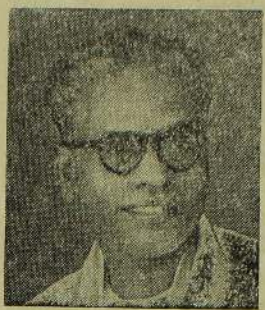
சருடைய கவனத்துக்குக் கொண்டுவர விரும்புகின்றேன்.

ஆனால், கள்ளத்தோணிகள் என்ற பெயரில் நாடற்றவர்கள் என்ற சாட்டில், இந் நாட்டில் பரம்பரை பரம்பரையாக வாழ்ந்துவரும் மக்களை சொந்தத்தில் காணிக் கைதுசெய்து வரவருகிறார்கள் என்ற உண்மையை கௌரவ பிரதம அமைச்சர்