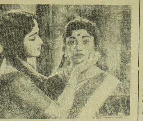
ஓ. எஸ். எஸ். தயாரிப்பாளர் 'சாந்தி' தமிழகத் திரைவானில் ஒரு பெரும் புரட்சியை ஏற்படுத்திவிட்டது. ஒரு குருட்டுப் பெண்ணின் ஆசாபாசங்களை மையமாக வைத்துப் பின்னப்பட்ட கதை அமைப்பைக் கொண்ட இப்படம் என்டர்டெயின்மென்ட்ஸ் அளிக்கும் அடுத்த திரைவிறகுத்தாகும். தேவிகாவும், விஜயதாமாரியும் தோன்றும் நெருக்குக்கும் கட்டியது.

நான் கலைஞராகவிரும்பும் இக்கலைத்துறைக்கே பல துரோகங்களைச் செய்திருக்கி