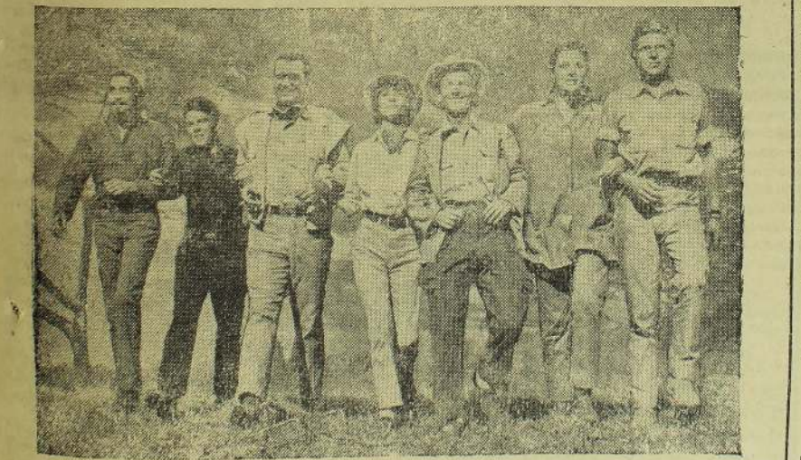
கொடிய வனவிலங்குகளை உயிருடன் வேட்டையாடப் புறப்பட்டுள்ள இக்கோஷ்டியை கொழும்பு விபர்ட்டி திரையில் ஓடிக்கொண்டிருக்கும் 'ஹட்டாரி' (HATARI) வர்ணப்படத்தில் காணலாம். இப்படத்தில் ஜோன்வான், ஹார்டிகுரூர், எல்லாமாட்டி எனெரி, டெட்டென்ஸ் முதலானோர் தோன்றுகின்றனர்.

ஓரவிழிப் பார்வையிலே உலகை மயக்க என்னும் சரோஜாதேவி, எதிரே கடமையே உருவாக நிற்கும் எம். ஜி. ஆரைக் கவர்ந்திருக்கத்தான் இப்பார்வை வீசுகிறார் போலும்—படம்: 'நீதிக்குப் பின் பாசம்'.