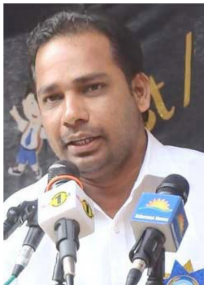
இலங்கைத் திருநாட்டில் தலை தூக்கிய இனவாதமும் மதவாதமும் இன்று சர்வதேசம் வரை நம்மைக் கொண்டு சென்று நிறுத்தியுள்ளது.