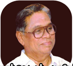
புலவர் இ.ரெ. சண்முகவடிவேல் தமிழ்நாடு