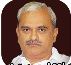
மாண்புமிகு வெ.வைத்திலிங்கம் சுபநாயகர், புதுச்சேரி எட்டசபை