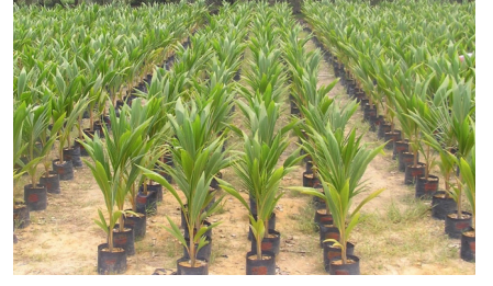
கொழும்பு, மார்ச் 28

இலங்கையில் இதுவரையில் 21 ஆயிரத்து 616 ஹெக்டேயர் தென்னை பயிர்ச்செய்கை அழிக்கப்பட்டுள்ளது.