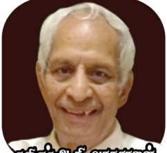
கவிஞர் அ.க. வரதராஜன் சிங்கப்பூர்