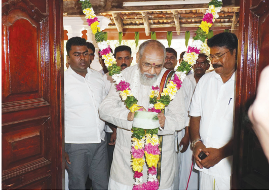
(முதலாம் பக்கத் தொடர்ச்சி) அரசியல், சமூகம் மற்றும் சுற்றுச் சூழல் செயற்பாட்டு இயக்கமாகத் தொழிற்பட்டுவரும் தமிழ்த் தேசியப் பசுமை இயக்கத்தின் தலைமைப் பணிமனை யாழ்ப்பாணத்தில் நேற்றுச் செய்வாய்க்

கிழமை திறந்து வைக்கப்பட்டது. அரசு வீதி, கந்தர்மடத்தில் அமைந்துள்ள இந்தப் பணிமனையை வடக்கு முதலமைச்சர் சி.வீ.விக்னேஸ்வரன் சம்பிரதாயபூர்வமாகத் திறந்து வைத்துள்ளார்.