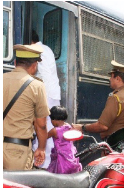
மன்னிப்பின் கீழ் விடுதலை செய்யப் பட்டுள்ளனர்.

கடந்த காலங்களில் நாட்டுக்கு எதிரான வன்முறைகளில் ஈடுபட்டவர்கள் எனப் பகிரங்கமாகத் தெரிந்த பலர் இன்றும் சுதந்திரமாக நடமாடிக் கொண்டிருக்கின்ற அதே நேரத்தில் சிறை வைக்கப்பட்டவர்கள் பலர் பொது