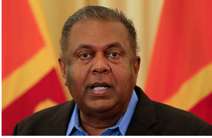
யான நோக்கத்தைக் கண்டறிய டார்.

நம்பிக்கையில்லாப் பிரேரணையில் யார் கைச்சாத்திட்டிருந்தாலும், இதன் உண்மை