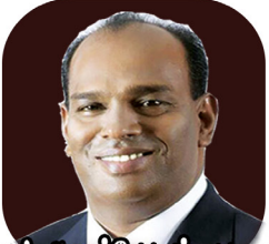
மாண்புமிகு டத்தோ எம். சரவணன் இளைஞர் விளையாட்டுத்தறை துணை அமைச்சர், மலேசியா