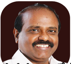
இலக்கியச்சுடர் து. இராமலிங்கம் தமிழ்நாடு