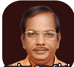
புலவர் மா. இராமலிங்கம் தமிழ்நாடு