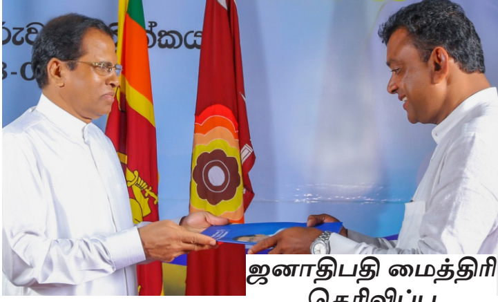
ஜனாதிபதி மைத்திரி தெரிவிப்பு