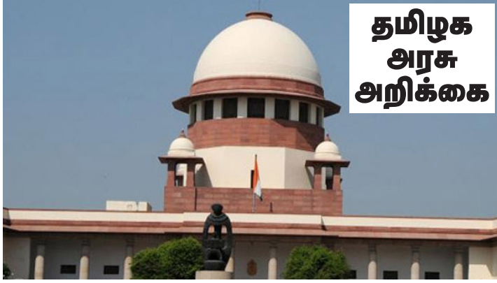
தமிழக அரசு அறிக்கை

காவிரி வழக்கில் கடந்த பெப்ரவரி மாதம் 16ஆம் திகதி இறுதித் தீர்ப்பு அளித்த உச்ச நீதிமன்றம், 6 வார காலத்துக்குள் காவிரி நடுவர் மன்ற இறுதித்தீர்ப்பை அமுல்படுத்துவதற்கான செயற்திட்டங்களை மத்திய அரசு முன்னெடுக்க வேண்டும் என்று உத்தர