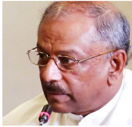
திணைக் குணவர்தன தெரிவிப்பு

எனினும், மேற்கொண்ட வேலைத்திட்டங்கள் எனக் கூறிக்கொள்வதற்கு எதுவும் இல்லை. நாட்டின் பொருளாதாரம் மீதான நம்பிக்கை இழக்கப்பட்டதன் அதனை மீண்டும் கட்டியெழுப்புவது மிகவும் சிரமமான விடயமாகும். மீண்டும் நம்பகத் தன்மையை