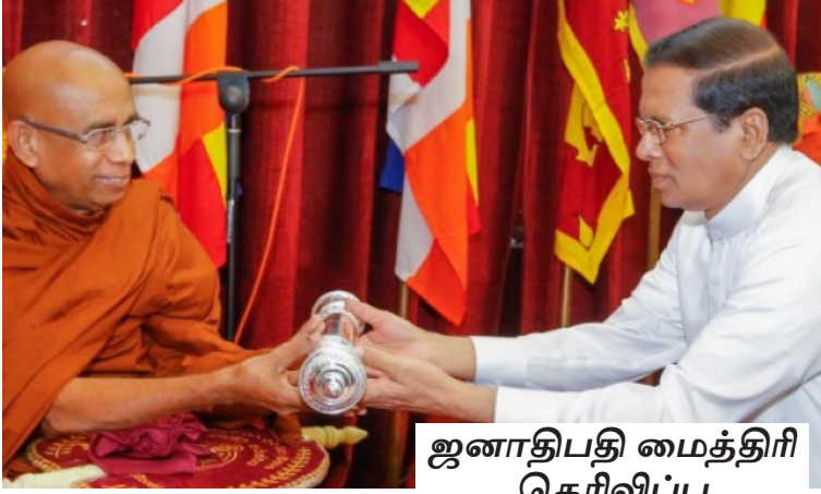
ஜனாதிபதி மைத்திரி தெரிவிப்பு

இந்த விடயம் தொடர்பில் மகா சங்கத்தினரால் விடுக்கப்பட்ட கோரிக்கையைக் கருத்திற்கொண்டே இந்தத் தீர்மானம் மேற்கொள்ளப்பட்டுள்ளது. எதிர்வரும் வெசாக் பௌர்ணமி தினத்தைத் தொடர்ந்துவரும் வாரத்தில் பௌத்த சமய கொண்டாட்டங்களை நாடு முழுவதும் கோலாகலமாக