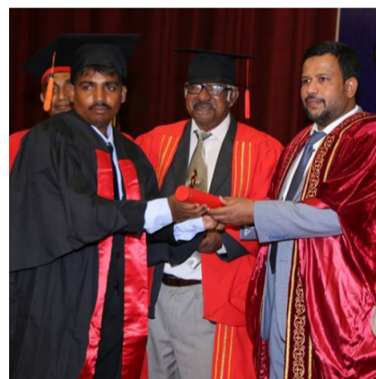
ரிஷாத் பதியுதீன் தெரிவிப்பு

இதுதொடர்பில் அவர் மேலும் தெரிவித்தவை வருமாறு:- பல்கலைக்கழகம் செல்வதற்கு சந்தர்ப்பம் கிடைக்காத மாணவர்களின் அறிவுத் தாகத்தை தீர்த்து வைத்து அவர்களைக் கல்விச் சமூக அந்தஸ்துக்குக் கொண்டுவர தனியார் உயர் கல்வி நிறுவனங்கள் பெரிதும் துணை புரிகின்றன.