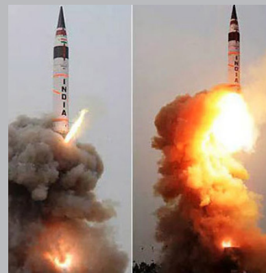
அழிக்கும் இந்த 'அக்னி-5' ஏவுகணைகள் சுமார் 5 ஆயிரம் கிலோ மீற்றர் தூரம்வரை, கண்டம்விட்டு

அணு ஆயுதங்களைத் தாங்கிச் சென்று எதிரிகளின் இலக்குகளை