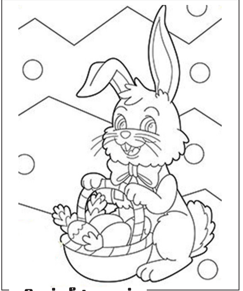
நிறம் தீட்டலாம் வாங்க