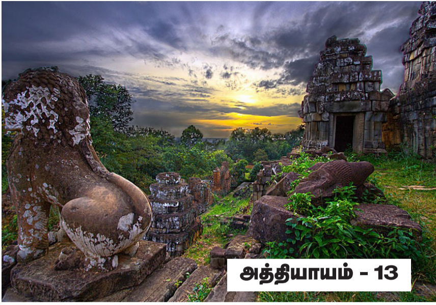
அத்தியாயம் - 13

மேல் அடுக்கில் மலை மீது மன்னர் அமர்ந்தவாறு மக்களிடம் குறை கேட்கிறார். கீழே காட்டிலுள்ள மலையிலிருந்து ஒரு பெண் நடந்து செல்கிறாள். ஆய்வு செய்வதற்காக ராணுவம் கூடியிருக்கிறது. யானை மீது அமர்ந்திருக்கும் படைத் தலைவர்கள் எதிரியை நோக்கிச் செல்லும் தமது படை அணிகளில் சேர்ந்து கொள்கிறார்கள். படை தளபதிகளின் பதவியைப் பற்றிய குறிப்பைச் சிலைக்கருகில் இருக்கும் கல்வெட்டு அறிவிக்கிறது. மாப்பின் மீது குறுக்காக போர்வாள் தொங்க மன்னன் இரண்டாம் சூரியவர் மன் யானை மீது நின்று கொண்டிருக்கிறான். பணியாளர்கள் 15 குடைகளைப் பிடித்தவாறு அவனைச் சூழ்ந்து நிற்கிறார்கள். மன்னனின் யானைக்கு முன்பாக இருக்கும் கொடிமரத்தில் கருடன் மீது நிற்கிற விஷ்ணு, பெட்டியில் ஏந்திய தீ வலம் செல்கிறது. அதனைத் தொடர்ந்து இசைவாணர்களும், விகடகவிகளும் செல்கிறார்கள். தாளம் போட்டவாறு பிரா