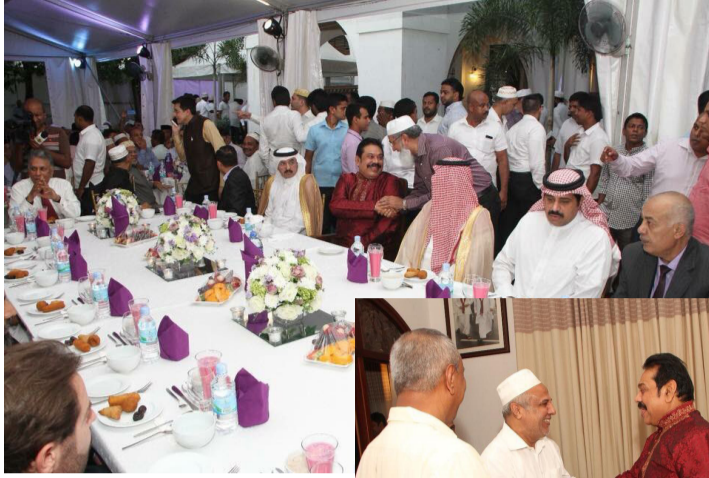
இந்த இப்தார் விருந்தில் சிறிலங்கா முஸ்லிம் காங்கிரஸ்

இந்தவிருந்துக்கு இம்முறை, முஸ்லிம் வணிகர்களுக்கு மாத்திரமன்றி, மேற்காசிய நாடுகளின் இராஜதந்திரிகளுக்கும் அழைப்பு விடுக்கப்பட்டிருந்தது.