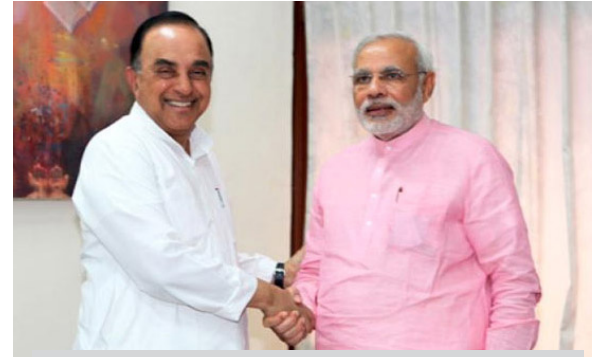
சுப்பிரமணிய சாமி விளக்கம்

இந்த நிலையில், துப்பாக்கிச் சூடு குறித்த முழு அறிக்கை வெளியாகாததாலே பிரதமர் மோடி எந்த கருத்தும் தெரிவிக்கவில்லை என பா.ஜ.க. மூத்த தலைவர் சுப்பிரமணிய சாமி நேற்று மதுரை விமான நிலையத்தில் தெரிவித்துள்ளார்.