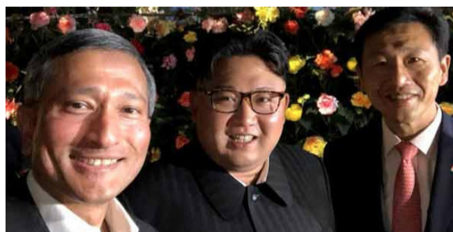
கிம் ஜாங் உன்னுடன் செல்பி எடுத்து மகிழ்ந்த சிங்கப்பூர் வெளியுறவு அமைச்சர் விவியன் பாலகிருஷ்ணன் தனது டுவீட்டர் பக்கத்திலும் பதிவேற்றியுள்ளார்.

பின்னர் இஸ்பலாண்டே என்ற பகுதிக்கு சென்ற கிம் ஜாங்கை அதிகாரிகள் வரவேற்றமையுடன் அவருடன் செல்பி எடுத்து மகிழ்ந்தனர். அதன் புகைப்படங்கள் சமூக வலைத்தளங்களில் வைரலாகப் பரவி வருகிறது.