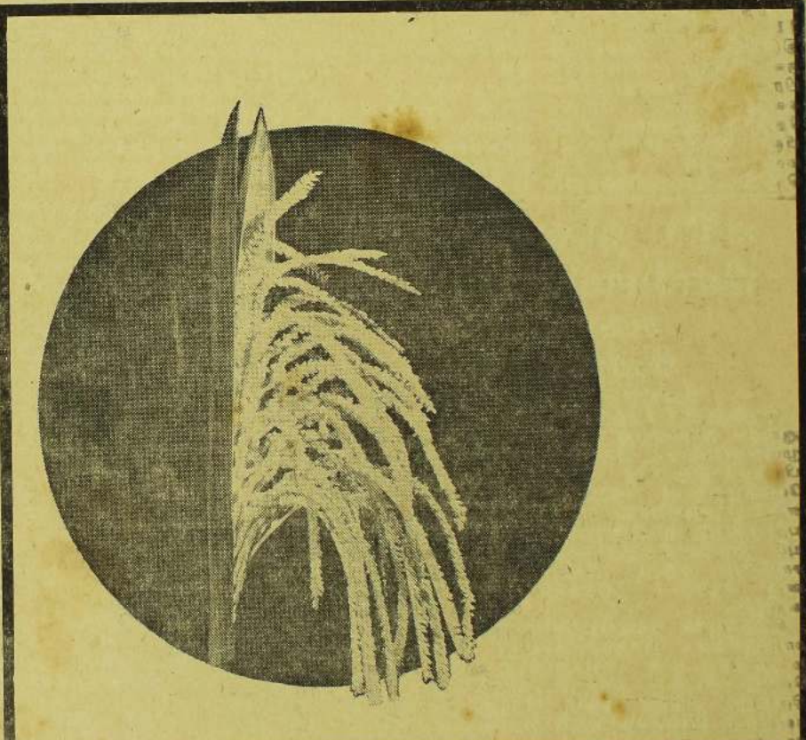
உங்கள் மண் பொன் விளையும் பூமியாக வளம் பெறு...