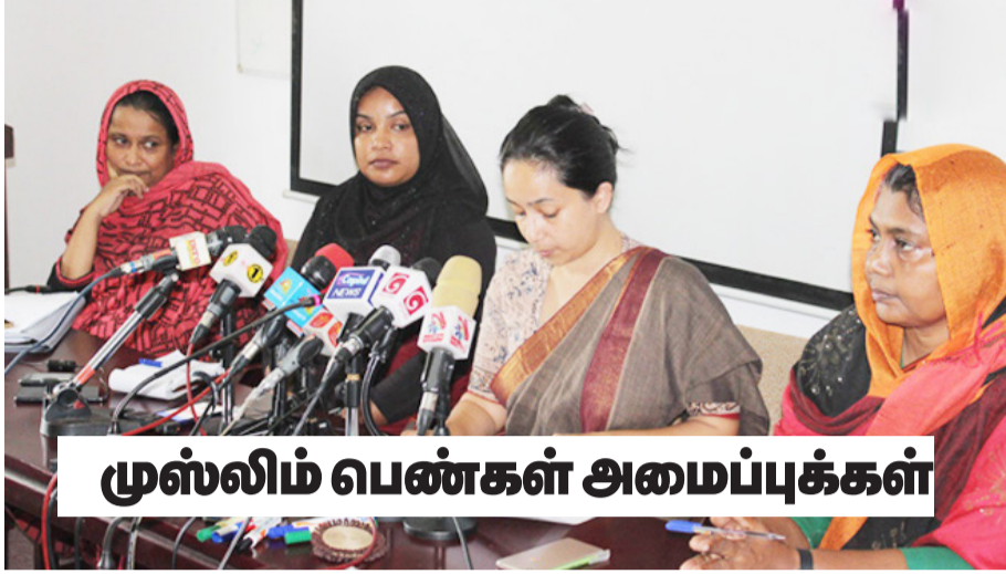
முஸ்லிம் பெண்கள் அமைப்புகள்

முஸ்லிம் தனியார் சட்டத்தில் திருத்தம் மேற்கொள்ள 2009ஆம் ஆண்டு முன்னாள் நீதியரசர் சலீம் மர்கூக் தலைமையில் அமைக்கப்பட்ட குழு தனது சிபாரிசு அறிக்கையை கடந்த ஜனவரி மாதம் நீதி அமைச்சரிடம் கையளித்தது. அந்த அறிக்கையில் குறிப்பிட்ட சில விடயங்களில் குழுவின் உறுப்பினர்கள் மத்தியில் புரண இணக்கப்பாடு இருக்கவில்லை.