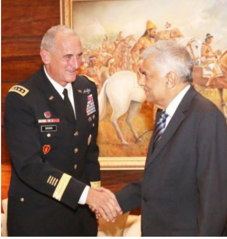
கொழும்பு, ஜூலை 25 இலங்கைக்கு விஜயம் மேற்கொண்டள்ள அமெரிக்க இராணுவ பசுபிக் கட்ட