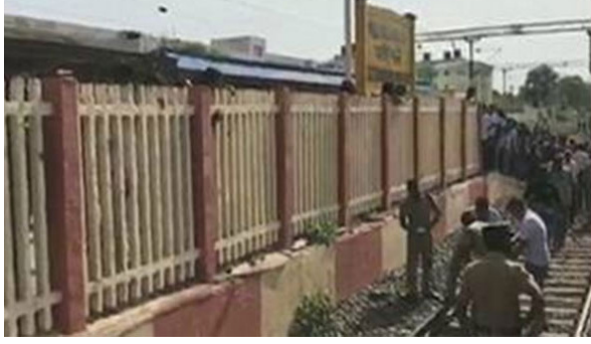
4 பேர் சிகிச்சை பயனின்றி உயிரிழந்தனர். 7 பேர் தீவிர சிகிச்சை பெற்று வருகின்றனர்.

இந்தநிலையில், பரங்கிமலை ரயில் நிலையத்தை நெருங்கியபோது, படிக்கட்டில் தொங்கிக்கொண்டிருந்தவர்கள் பக்கவாட்டில் உள்ள தடுப்புச்சுவரில் மோதி கீழே விழுந்தனர். பலத்த காயமடைந்த அவர்கள் உடனடியாக மீட்கப்பட்டு மருத்துவமனைக்கு கொண்டு செல்லப்பட்டனர். இதில் பாடசாலை, கல்லூரி மாணவர்கள் உள்பட