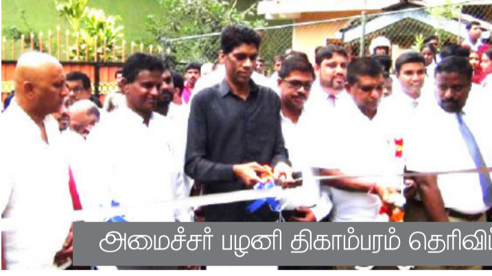
அமைச்சர் பழனி திகாம்பரம் தெரிவிப்பு

இதன் போது கதிர்சேன் கல்லூரியின் பழைய மாணவர் சங்கத்தினரால் ஒழுங்கு செய்யப்பட்டிருந்த இந்த திறப்பு விழா நிகழ்வில் பிரதம அத்தியாக கலந்துகொண்டு உரை நிகழ்த்துகையில் அவர் இவ்வாறு