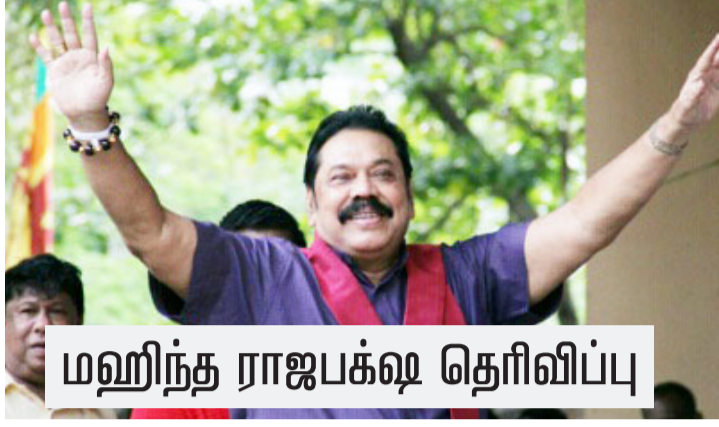
மஹிந்த ராஜபக்ஷ தெரிவிப்பு

நாடு தற்போது மிகவும் பயங்கரநிலையை அடைந்துவருகிறது. மக்களால் தமது வாழ்க்கையைக் கொண்டு நடத்த முடியாது திணறுகின்றனர். பொருள்களின் விலை என்றமில்லாதவாறு அதிகரித்துள்ளது. மூன்று நேரம் உணவு உண்டு வாழ்ந்த சமூகம் தற்போது ஒரு வேளை உணவுடன் கட்டுப்படுத்திக்கொள்ளும் நிலை ஏற்பட்டுள்ளது. அந்நிலைக்கு தாய்