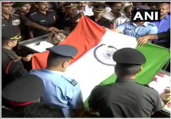
ராஜாஜி அரங்கத்தில் வைக்கப்பட்ட தி.மு.க. தலைவர் கருணாநிதி உடலுக்கு தேசிய கொடி போர்த்தி அரசு மரியாதை செலுத்தப்பட்டது. காவேரி மருத்துவமனையில் சிகிச்சைக்காக சேர்க்கப்பட்டிருந்த தி.மு.க. தலைவர் கருணாநிதி நேற்று முன்தினம் மாலை 6.10 மணிக்கு காலமானார். இதனை அடுத்து, ஜனாதிபதி, பிரதமர் உட்பட பல தலைவர்கள் அவரது மரணத்திற்கு இரங்கல் தெரிவித்து வருகின்றனர்.

கருணாநிதியின் உடல் காவேரி மருத்துவமனையில் இருந்து முதலில் கோபாலபுரம் இல்லத்தில் உறவினர்கள் அஞ்சலிக்காக வைக்கப்பட்டது. இதையடுத்து, அங்கிருந்து சி.ஐ.டி. காலனிக்கு அவரது உடல் எடுத்துச் செல்லப்பட்டு, அங்கும் பொதுமக்கள் அஞ்சலிக்கு வைக்கப்பட்டது.