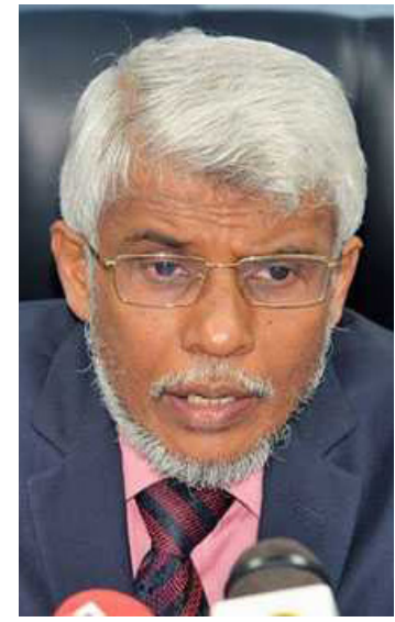
லாதொழிப்பதாகவே அமைந்து விடும்.

ஆனால், நல்லாட்சி அரசின் தற்போதைய போக்கு அந்த மூன்றாவது சிறுபான்மையினரான முஸ்லிம்களைத் தோற்கடிப்பதாக அமைந்திருக்கிறது. நல்லாட்சி அரசு கலப்புத் தேர்தல் முறையை அமுல்படுத்துவதன் மூலம் நாட்டின் மூன்றாவது சிறுபான்மையான முஸ்லிம் சமூகத்தை அரசியல் பிரதிநிதித்துவம் அற்றவர்களாக்குவதோடு அவர்களது இன்னபிற அரசியல் உரிமைகளையும் இல்