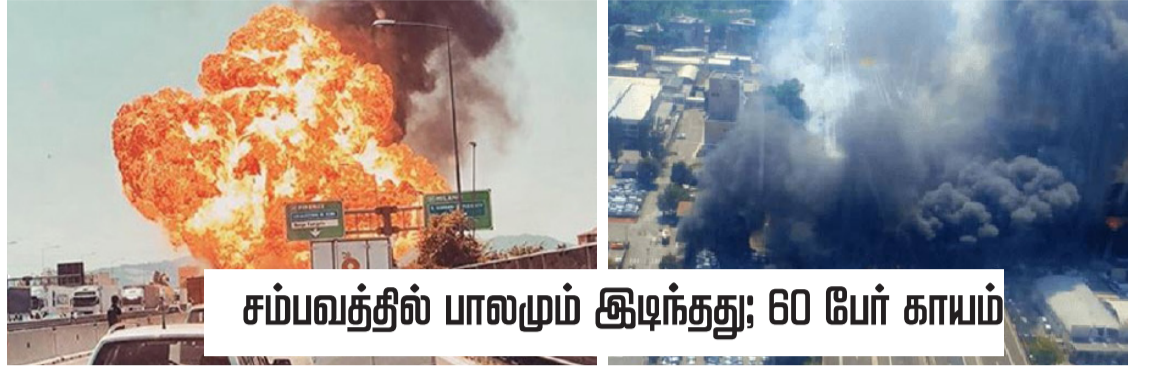
சம்பவத்தில் பாலமும் இடிந்தது; 60 பேர் காயம்

இத்தாலியின் பொலாக்னா விமான நிலையம் அருகே டாங்கர் லொறிகள் மோதி தீப்பற்றிய தில் 2 பேர் பலியாகினர். 60 பேர் காயமடைந்தனர்.