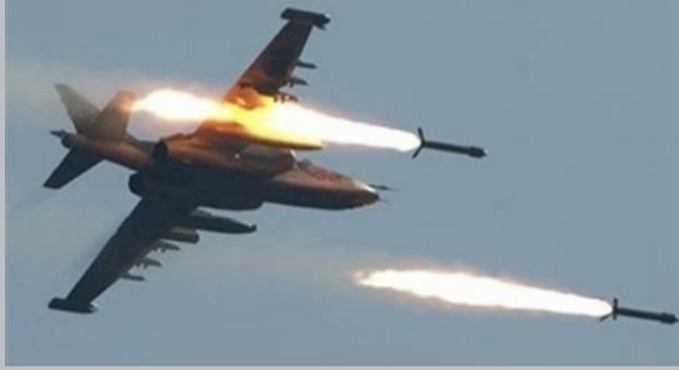
றது. அதே நேரத்தில் ஜனாதிபதி ஆதரவு படைகளுக்கு ஆதர

இதில் ஹவுதி கிளர்ச்சியாளர்களை ஈரான் ஆதரிக்கி