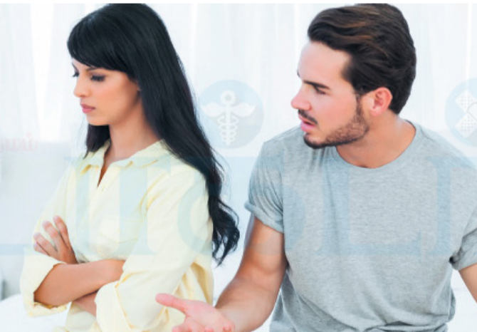
களை சரி பார்க்கத்தான் நேரம் சரியாக இருக்கி

உங்கள் அவரின் சிரிப்பு, அழகை, கோபம் போன்ற வெளிப்பாடுகளை விட, உங் கள் போனில் வரும் போலியான வெளிப்பாடு