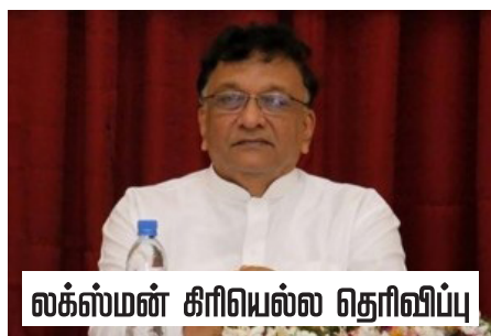
லக்ஸ்மன் கிரியெல்ல தெரிவிப்பு

இந்த நிலையில், முன்னர் அனூர பண்டாரநாயக்க சபாநாயகராக இருந்த