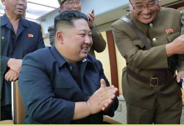
யாராலும் வெல்ல முடியாத திறன்களை வடகொரியா இராணுவம் பெற்று விளங்குவதாக அந்த இராணுவத்தை அந்நாட்டு அதிபர் புகழ்ந்தார் எனக் கூறப்படுகிறது.

அமெரிக்காவும், தென் கொரியாவும் இராணுவ கூட்டுப் பயிற்சியில் ஈடுபடுகின்ற மையத் தங்கள் நாட்டிற்கு எதிரான படையெடுப்புக்கான ஒத்திகை என்று வடகொரியா கருதுகிறது. ஒவ்வொரு முறை அந்தநாடுகள் பயிற்சியில் ஈடுபடும்போதும் வடகொரியா தனது ஆயுத பலத்தை பயன்படுத்தி எச்சரிக்கை செய்வது வழக்கம்.