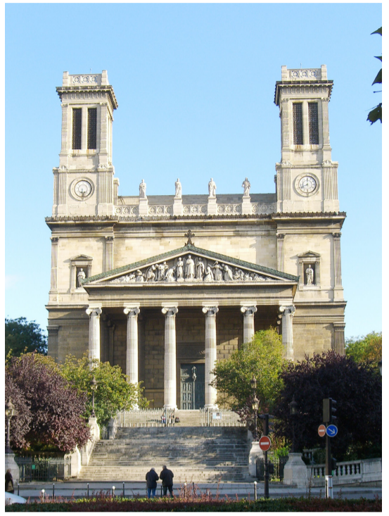
பிரான்ஸ் நாட்டு ஆர்ஸ் நகரிலும்

என்று இலங்கை ஆயர் பேரவை, ஓர் அறிக்கையை, வருத்தத்துடன் வெளியிட்டுள்ளது. இதற்கிடையே இலங்கை அரசுத்தலைவர் தேர்தல் இவ்வாண்டு நவம்பர் மாதம் நடைபெறவிருப்பதை மனதில் கொண்டு உயிர்ப்பு ஞாயிறு கொடுமைக்கு தகுந்த தீர்வுகள் காணும் வரையில் அரசுத்தலைவர் தேர்தலில் போட்டியிடவிருக்கும் வேட்பாளர்கள் யாரையும் தான் சந்திக்கப் போவதில்லை என்று கொழும்பு பேராயர் கர்தினால் மல்கம் ரஞ்சித் அவர்கள் கூறியுள்ளார் என்பது குறிப்பிடத்தக்கது. 21 ஏப்ரல் 2019 உயிர்ப்பு ஞாயிறு காலை இலங்கையின் மூன்று ஆலயங்களிலும் மூன்று விடுதிகளிலும் நடத்தப்பட்ட தாக்குதல்களுள் கொழும்பு நகரின் புகழ்பெற்ற புனித அந்தோனியார் திருத்தலத்திலும் கட்டுவபிட்டிய புனித செபஸ்தியார் கோவிலிலும் நடத்தப்பட்ட தாக்குதல்களில், அதிக உயிரிழப்புக்கள் இடம்பெற்றுள்ளன.