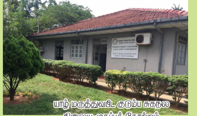
யாழ் மருத்துவபீட குடும்ப சுகநல நிலைய முகப்புத் தோற்றம்

வருகின்றனர். பொது மக்கள் மற்றும் நோயாளிகள் செயற்றிட்டத்தில் வடமாகாண சுகாதார அமைச்சு குடும்ப சுகநல நிலைய நோயாளர் நலன்புரிச் சங்கமும் முக்கிய பங்குதாரர்களாக இருக்கின்றமை சிறப்பானதாகும்.