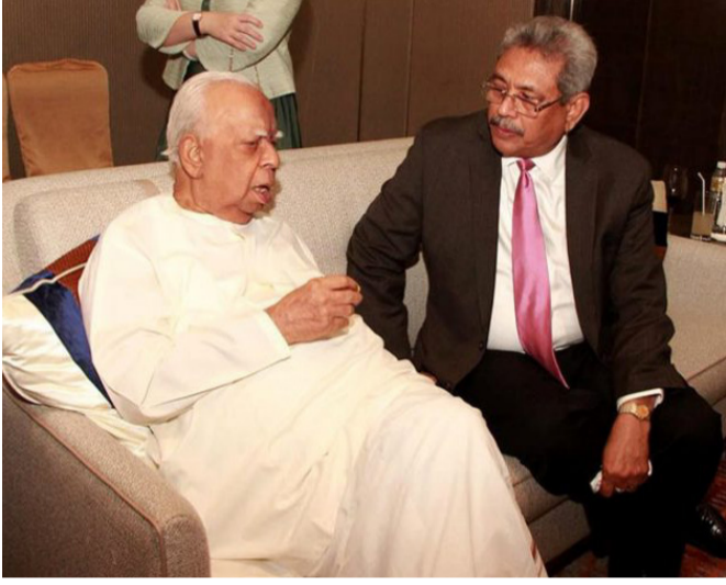
கொழும்பு, ஓக. 24 ஸ்ரீலங்கா பொதுஜன பெரமுன தலைமை

யிலான கூட்டு எதிரணியின் ஜனாதிபதி வேட்பாளர் கோட்டாபய ராஜபக்ஷவுக்கும், தமிழ்த் தேசியக் கூட்டமைப்பின் தலைவர் இரா. சம்பந்தனுக்குமிடையில் விரைவில் சந்திப்பு நடைபெறவுள்ளது.