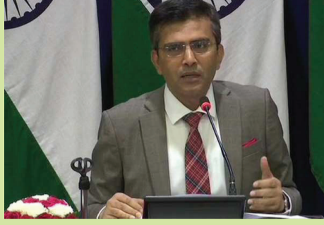
இதற்குப் பதிலளித்துள்ள இந்திய

புதுடில்லி, ஓக.31 பயங்கரவாதத்தை எங்கள் நாட்டிற்குள் புகுத்துவதை நிறுத்தி விட்டு, மற்ற அண்டை நாடுகளைப் போல் நடந்து கொள்ளுங்கள் எனப் பாகிஸ்தானிற்கு இந்தியா கண்டிப்புடன் எச்சரித்துள்ளது. காஷ்மீரில் அம்மா நிலத்துக்கான சிறப்பு அந்தஸ்து ரத்து செய்யப்பட்டதற்காக இந்தியாவிற்கு மிரட்டல் விடுக்கும் விதமாக பாகிஸ்தான் அரசு மற்றும் அந்நாட்டுத் தலைவர்கள் பேசி வருகின்றனர்.