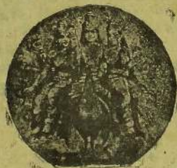
நல்லூர் - கேதீச்சரம்

விழாத்தலைவர் பிரம்மலிங்கம் கி. வா. ஜகந்நாதன் அவர்கள் சிறப்புரை வழங்கினார். மணிவிழாக்கண்ட குருக்கள் அவர்களில் இயல்பாயமைந்த அரிய குணத்தினை (வளர்ச்சி மே பக்கம்)