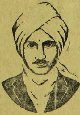
(1 ஆம் பக்கத்து வளர்ச்சி)

மெத்த வளருது மேற்கே -- அந்த மேன்மைக் கலைகள் தமிழினில் இல்லை