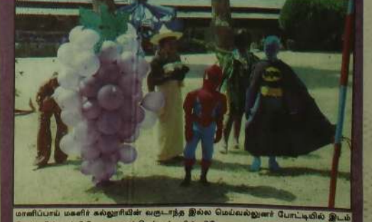
மாணிட்பம் மகிழ்ச்சியில் வருடாந்த இலம் மெய்வல்லுரை போட்டியில் இடம் பெற்ற சிங்களத்திரிய மணவல் செல்வங்களின் விசேஷ உடை திகழும்.