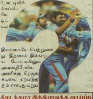
இலங்கையே பெற்றுள்ளது. இதனால் இன்றைய போட்டியிலும் அவுஸ்திரேலிய அணிக்கு நெருக்கடியை ஏற்படுத்தும் என்பது மறுப்பதற்கில்லை.

பதற்கில்லை. எது எவ்வாறு இருப்பினும் இன்றைய போட்டியில் முடிவு இறுதிப்போட்டியில் அவுஸ்திரேலிய அணிக்கு வெற்றி பெறும் என அணியா, அணியா என்பதை உறுதிப்படுத்தும்.