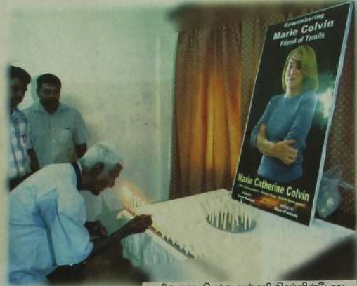
யாழில் நடைபெற்ற அஞ்சலி நிகழ்வின் போது...

கோசோவோ, செசென்யா, கிழக்கு திமோர், லிபியா உட்பட பல நாடுகளில் பணியாற்றிய அனுபவம் உடையவர். அரசியல் இஸ்தித்தன்மையற்ற பல அரசு நாடுகளிலும் தனது பணியினை மேற்கொண்டு அங்கு நடக்கும் சம்பவங்களைத் துணிச்சலுடன் பேசியும் எழுதியும் வந்தவர். கடந்த 2001ஆம் ஆண்டு விடுதலைப்புலிகளின் கட்டுப்பாட்டு பகுதிகளில் செய்தி சேகரிக்க, எல்லை யைத் தாண்டியபோது அரசு படையினர் நடத்திய