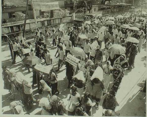
பிரேரிக்குமா அல்லது கண்டா, மற்றும் ஐரோப்பிய நேசநாடுகளினூடாக பிரேரிக்குமா என்று இலங்கை எதிர்நோக்கும் தற்போதைய பெரும் புதிருகும்.

காத்திருக்கிறார்கள். பிரிவும், உயிரிழப்பும் தருகின்ற துயரத்திற்கு மீண்டுமே ஐ.நா. தமது வாய்க்காலையே முன்னேக்கி சீரமைத்துக் கொள்வதற்கான மனிதநியாயம் மற்றும் பொருண்மரீதியான உதவிகளை வழங்குவது அரசுக்கு முக்கியமான கடமை. அதற்கும் ஒத்தபடி மேலே சென்று இணங்குகக்கிடையேயான சுமுக உறவையும், நல்லிணக்கத்தை மேம்படுத்துவதற்கான முன்னெடுப்புக்களை மேற்கொள்வதும் அரசின் மிக முக்கிய பொறுப்பு. நாட்டு மக்கள் அனைவரினதும் சுமுகமான எதிர்காலத்தை மனதில் கொண்டு, ஐ.நா. தீர்மானம் தரக்கூடிய அழுத்தங்கள் எதிர்பார்க்கப்பட வேண்டும். ஏற்கனவே கற்றுக்கொண்ட அனுபவப் பாடங்கள், இத்தகைய பெருந்தயர் கொண்டு போழிவு மீண்டும் ஏற்படாமல் இருப்பதற்கும், சமூகங்களுக்கு கிடையேயான நட்பும், புரிந்துணர்வும் வளர்வதற்கான காரணியாகவும் அமைய வேண்டும். தீர்மானத்தினால் ஏற்படக்கூடிய விளைவுகளைவிட மக்களின் எதிர்காலம் குறித்த அக்கறை முன்னறித்தப்பட வேண்டும்.