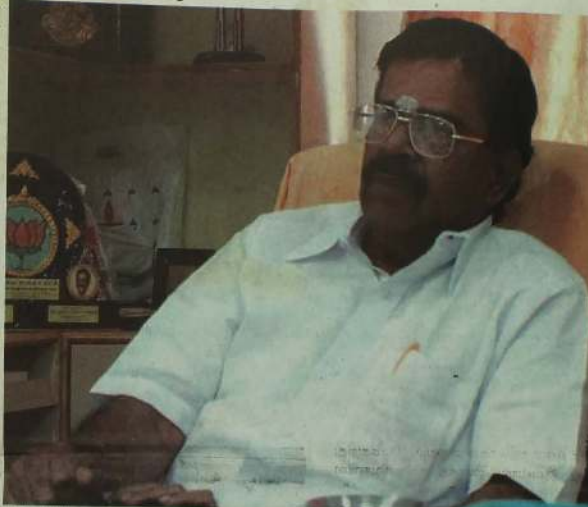
முத்த தலைவர் இல. கணேசனை சந்தித்தோம்...