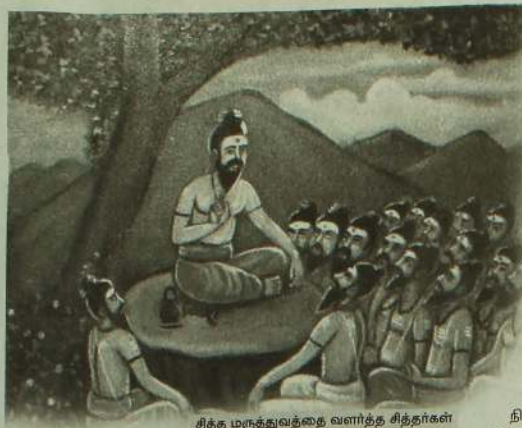
சித்த மருத்துவத்தை வளர்த்த சித்தர்கள்