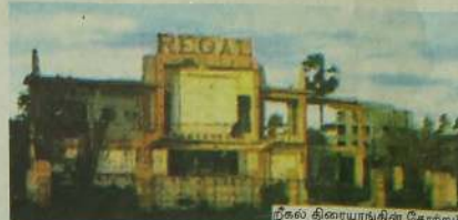
நீகல் திரையரங்கின் தோற்றம்

இவ்வாறாக நீகல் திரையரங்கு என்றால் ஆங்கிலத் திரைப்படம் பார்ப்பதற்கு பேர் போன இடமாக காணப்பட்டது. 1960 களின் பின் சிறிது சிறிதாக தமிழ்த் திரைப்படங்களும் திரையிடப்பட்டது. சிறுவர் முதல் பெரியவர் வரை யாழ் நகரில் தெரிந்த ஒரே இடம் ரீல் திரையரங்குதான் இங்கு திரையிடப்பட்ட ஆங்கிலத்திரைப்படங்கள் மூலம் ஆங்கில அறிவை வளர்த்துக் கொண்டார்களாம் என்பது அங்கு பார்த்தவர்களின் கருத்து. மேலும் திரைப்படங்களை வினம்பரம் செய்வதற்கு பறையடிக்கப்பட்டும், மாட்டுவண்டியில் சென்று துண்டுப்பிரசாரகளை விநியோகித்தும் மக்கள் மத்தியில் திரைப்படங்களை அறிமுகம் செய்தனர். மாட்டுவண்டியில் இருக்கமும் திரைப்பட வினம்பர போஸ்டர்கள் கட்டப்பட்டு ஒருவர் அப்படம் பற்றி விபரித்துக் கொண்டு செல்வார்கள். இருப்பினும் நீகல் திரையரங்கு கட்டிடம் மட்டும் கோட்டையை பார்த்த வண்ணம் மன்றியடித்த புதருக்குள் பழைய ஆங்கிலத் திரைப்பட போஸ்டர்களுடன் காணப்பட்டது. ஆனால் கடந்த சில வருடங்களுக்கு முன் அக்கட்டிடமும் இடித்து தரைமட்டமாக்கப்பட்டுவிட்டது. தற்பொழுது அவ் உரிமையாளரின் வாரிசுகள் அதில் 'பல்வணிகத்தளம்' கட்டப்போவதாகவும் அதில் மீண்டும் ரீல் திரையரங்கு வரும் என்றும் கூறினார்கள்.