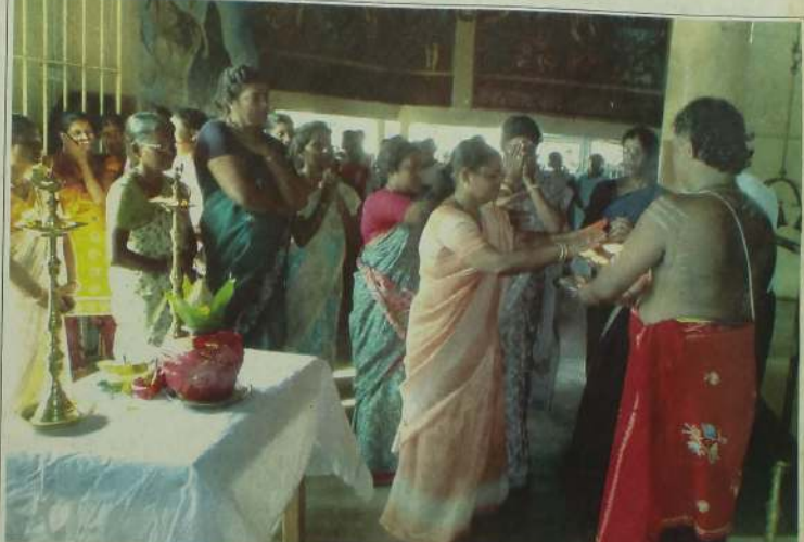
நேற்று முன்தினம் யாழ். செயலகத்தில் அரசிற்கு ஆதரவு தெரிவித்து நடைபெற ஆரம்பிக்கப்பட்ட பின்னர் செயலக ஊழியர்கள் ஜனாதிபதிக்கு ஆசி வேண்டி யாழ். முத்த விநாயகர் ஆலயத்தில் வழிபாடுகளில் ஈடுபட்டிருப்பதை படத்தில் காணலாம்.

முக்கிய சம்பவங்கள் தொடர்பான பதிவு - 2011 (Enumeration of Vital Events-2011) எனப் பெயரிடப்பட்டு வெளியிடப்பட்ட 80 பக்க அறிக்கையில் மே 2009 இல் யுத்தம் நிறைவுக்கு வருவதற்கு முன் நான்கு ஆண்டு காலப்பகுதியில் யாழ்ப்பாணம், மன்னார், முல்லைத்