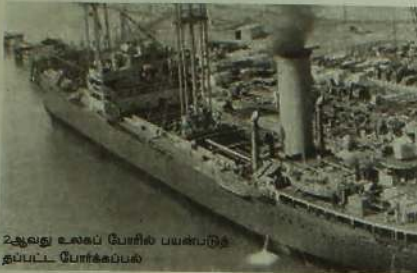
2ஆவது உலகப் போரில் பயன்படுத்தப்பட்ட போர்கப்பல்.

மலம் சுற்றாடலில் பிறந்த குழந்தைகள் குறை உடல் உறுப்புகளுடன் பிறந்தன. இன்று கூட அந்த நாட்டில் ஏற்பட்ட மூகம்பத்தினால் அணுகுண்டுகள் பாதிக்கப்பட்ட அங்கு விளையும் நெல் கதிர்களில் அணுகுண்டுகள் இருப்பதாக அந்த நாடு அறிவித்தள்ளது. முதலாவது உலக மகா யுத்தத்தில் கொல்லப்பட்ட மக்களின் தொகை 2 கோடி இரண்டாவது உலகப் போரில் கொல்லப்பட்டவர் தொகை 5 கோடி முதலாவது உலகப்போரில் பிரேங்கிசு, டாங்கிசு, கப்பல் கள் என்பன அதிகமாகப் பயன்படுத்தப்பட்டன. யுத்தத்தின் இறுதிக் கட்டத்தில் சோவியத் யூனியனின் தரைப்படையினரிடம் ஹிட்லர் படைகள் படு தோல்வி அடைந்தன. சோவியத் படைகள் பல முனைகளில் முன்னேறி சுற்றி வளைத்தனர். ஆனால் ஹிட்லர் சரணடைய வேண்டும் என்று முடிவுக்கு ஒத்துக் கொள்ளவில்லை. ஜூலை 1945 தொடக்கம் ஹிட்லரின் படைகளுக்காக 1000 யுத்த டாங்கிகளும் 2800 போர் விமானங்களும் உற்பத்தி செய்யப்பட்டன.