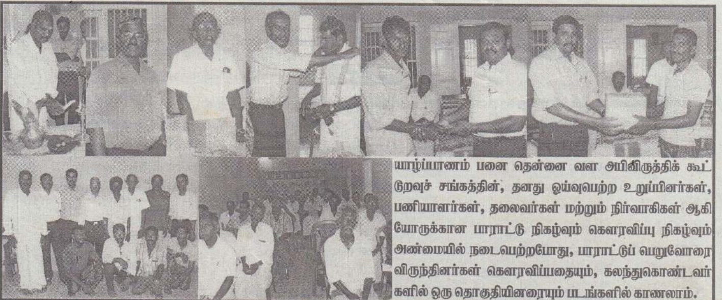
யாழ்ப்பாணம் பனை தென்னை வள அபிவிருத்திக் கூட்டுறவுச் சங்கத்தின், தனது ஓய்வுபெற்ற உறுப்பினர்கள், பணியாளர்கள், தலைவர்கள் மற்றும் நிர்வாகிகள் ஆகியோருக்கான யாராட்டு நிகழ்வும் கௌரவிப்பு நிகழ்வும் அண்மையில் நடைபெற்றபோது, யாராட்டுப் பெறுவோரை விருந்தினர்கள் கௌரவிப்பதையும், கலந்துகொண்டவர்களில் ஒரு தொகுதியினரையும் படங்களில் காணலாம்.

ஆறு போத்தல் பதநீரை (கரும்பணி) பொன்றிறமாகக் காய்ச்சி, சுண்ணாம்பை அடையவிட்டு பெறப்பட்ட தெளிந்த பதநீருடன், அரை கொத்து பச்சை அரிசியை மாவாக இடித்து அதில் 1/8 பங்கு பால் பேணி மாவை எடுத்து சேர்த்து குழைத்து, சிறு சிறு உருண்டைகளாகப் பிடித்து ஒரு(1) தேங்காய்ப் பாலில் மாவைக் கரைத்து, கொதிக்க வைத்த பொன்னிற பதநீரில் அரைத்த மாவை ஊற்றி துளாவி, பின்பு 1/4 இறாத்தல் வறுத்த பயறு அல்லது உழுந்து, பாதி இளந்தேங்காய் சொட்டுக்கள், மா உருண்டைகள் எல்லாவற்றையும் அதனுள் போட்டு கூழ் பருவம் வரும்வரை நன்றாக கொதிக்கவைத்து அளவான உப்பிட்டு இறக்கிப் பருகலாம். (முற்றும்)