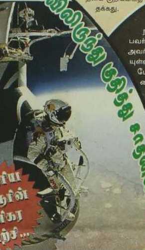
ஆஸ்திரிய இளைஞர் அளிகர முயற்சி...

பூமிக்கு மேலே 18 மைலுக்கும் அதிகமான உயரத்தில் இருந்து குதித்த ஆஸ்திரியாவைச் சேர்ந்த சாகஸ் கலைஞரான பீலிக்ஸ் போம்கார்ட்னர் புதன்கிழமை சாதனை படைத்துள்ளார். அவர் குதித்த உயரம் அதி வேகமாகச் செல்லும் ஜெட் விமானங்கள் பயணிக்கும் பாதையை விட சுமார் மூன்று மடங்கு உயரமானதாகும். பீலிக்ஸ் போம்கார்ட்னர் (43 வயது) நியூ மெக்ஸிக்கோவில் ரொஸ்வெல் நகருக்கு அண்மையில் பறந்த விசேட பறக்கும் உபகரணமொன்றிலிருந்து மணிக்கு 536 மைல் வேகத்தில் விழுந்துள்ளார். அவர் எதிர்வரும் மாதம் பராகூட்டில் பூமியிலிருந்து 23 மைல் தூரத்திலிருந்து குதித்து சாதனையை நிறைவேற்ற திட்டமிட்டுள்ளார். அவரது சாதனை முயற்சியை 1960 ஆம் ஆண்டு பூமியிலிருந்து 19.5 மைல் உயரத்திலிருந்து குதித்து உலக சாதனை படைத்த ஜோ கிட்ஹெர் (தற்போது 84 வயது) மேற்பார்வை செய்தமை குறிப்பிடத்தக்கது. முன்னர் பராகூட்டில் குதிக்கும் இராணுவ வீரர்கள் பீலிக்ஸ் போம்கார்ட்னர், இதுவரை விமானங்கள், உலங்குவானூர்திகள், தாய்வானிய தலைநகரிலுள்ள 101 யாடி கட்டம் உள்ளடங்கலான உயரமான கட்டடங்களிலிருந்து 2500 இற்கு மேற்பட்ட தடவைகள் குதித்துள்ளார்.