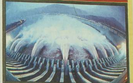
சீனாவில் ஏற்பட்ட அளவு கடந்த மழைவீழ்ச்சி காரணமாக ஹூபி மாகாணத்தில் யங்டல் ஆற்றிலுள்ள இராட்சத தீர் கோட்டில் தீர் மின்சக்தி பிறப்பாக்கி அணைவின் இறுதி 32 மீன் பிறப்பாக்கிகளும் திறந்து வைக்கப்பட்டதால் அந்த அணை உலகிலேயே அதி சக்தி வாய்ந்த மின் பிறப்பாக்க அளவையாக மாறி உள்ளது. அதிலிருந்து பிறப்பிக்கப்படும் சக்தி 15 அணுசக்தி பிறப்பாக்கிகளிலிருந்து பிறப்பிக்கப்படும் சக்திக்கு சமமானதாகும்.