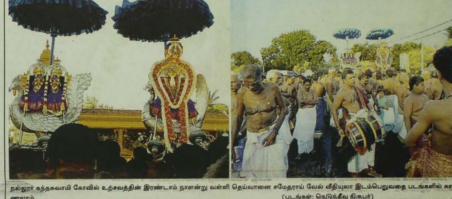
நல்லூர் கந்தகவமி கோவில் உற்சவத்தின் இரண்டாம் நாளன்று வள்ளி தெய்வானை சமேதாரம் வேல் வீதியில் இடம்பெறவுகிற படங்களில் காணப்படும்.

தரனின் புலவர் போற்றிடும் புலவர், ஈஸ்வரனின் நகரீகரம் திருமுருகாற்றுப்படை யும், சைவப்புலவர் கந்த சத்தியதாசனின் ஆலயம் தானும் அரன் எனத் தொழுமே என்று தலைப்புகளில் நிகழ்த்தவுள்ளனர். தொடர்ந்து இவ்வாலை, ஆவரங்கால், காரைநகர், புத்தூர், சங்கானை, திடற்புலம், கோண்டாவில் ஆகிய இடங்களின் அற நெறிப்பாடசாலை மாணவர்களின் கலை நிகழ்வுகளும் இடம்பெறவுள்ளன.