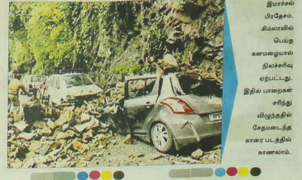
இமாச்சல் பிரதேசம், சிம்லாவில் பெய்த கனமழையால் நிலச்சரிவு ஏற்பட்டது. இதில் பாறைகள் சரிந்து சேதமடைந்த காளை படத்தில் காணலாம்.

புதுடில்லி: மத்திய அரசு அறிவிப்பு ஆம் திகதி விசாரணைக்கு வந்தது. அப்போது, 'வன்முறையில் ஈடுபட்டு பொதுச்சொத்துகளுக்கு சேதம் ஏற்படுத்தும், அரசியல் கட்சிகளை, தற்போதைய சட்ட விதிகளின் கீழ் தடை செய்ய முடியுமா? அவற்றின் அங்கீகாரத்தை இரத்துச் செய்யலாமா? என கேள்வி எழுப்பிய நீதிபதிகள், இது தொடர்பாக மத்திய அரசு ஒரு வாாத்நிற்கும் பதில் அளிக்க வேண்டும்' என உத்தரவிட்டனர். இந்தநிலையில், இந்த வழக்கு நேற்று முன்தினம் மீண்டும் விசாரணைக்கு வந்தது. அப்போது, மத்திய அரசு சார்பில் அஜூரன் செலிசிட்டுர் ஜெனரல் ரோகின்டன் நாரி மன் கூறியதாகவு, 'போராட்டத்தில் ஈடுபடும்போது அரசியல் கட்சியினர் பொதுச் சொத்துகளை சேதப்படுத்துவதற்காக குறிப்பிட்ட அரசியல் கட்சியின் அங்கீகாரத்தை, தேர்தல் ஆணையமோ நீதிமன்றமோ இரத்துச் செய்ய முடியாது. உச்ச நீதிமன்றமே, இது தொடர்பாக வழக்கு ஒன்றில் தீர்ப்பு அளித்துள்ளது என்றார்.