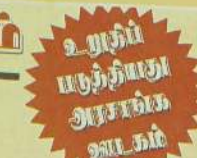
உயர்நீதி மன்றம் அரங்கம் உயர்நீதி மன்றம் அரங்கம்

ரங்களைக் பல்வேறு ஊகங்கள் நிலவி வந்த நிலையில், அந்த ஊகங்களுக்கு மேற்படி செய்தி முடிவு கட்டியுள்ளது. வடகொரிய ஊடகத்தில் புதன்கிழமை இரவு 8:00 மணிக்கு ஒலிபரப்பப்பட்ட 8 நிமிட செய்தியிலேயே மேற்படி தகவல் வெளியிடப்பட்டுள்ளது. கடந்த வருடம் டிசம்பர் மாதம் தனது தந்தை கிம் யொங்- இல் மரணமடைந்ததை யடுத்து அவரிடமிருந்து கிம் யொங்- உன் ஆட்சிப் பொறுப்பை ஏற்றுக்கொண்டார். வடகொரியாவில் ரி சேல் - யு என்ற பெயரில் பாடகியொருவரும் உள்ள நிலையில் அப்பெண்ணை கிம் யொங்- உன்னின் மனைவி என்பது உறுதிப்படுத்தப்படவில்லை. அதேசமயம் இந்த ஜோடி எப்போது திருமண பந்தத்தில் இணைந்தது என்ற தகவலும் வெளியிடப்படவில்லை.