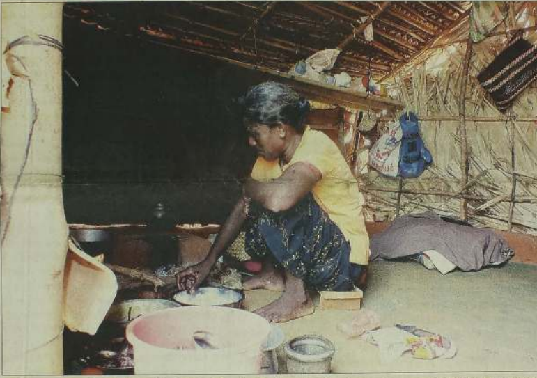
வலி, வடக்கு வசவிளான் மேற்குப்பகுதியில் மீள்குடியேறியுள்ள மக்கள் போதிய அடிப்படை வசதிகள் இன்றி காணப்படுகின்றனர். இங்கு சிறிய குடிசையில் பெண்ணொருவர் தனது சமையல் கடமையில் ஈடுபட்டிருப்பதை படத்தில் காணலாம். (படப்பிடிப்பு: எம். தியூட்டன்)

(எம். தியூட்டன்) வலி, வடக்கு வசவிளான் மேற்குப் பகுதியில் கடந்த நான்கு மாதங்களாக மீள்குடியேறிய மக்களுக்கு வலி, வடக்குப் பிரதேச சபையினால் நீர் விநியோகம் சீரான முறையில் மேற்கொள்ளப்படவில்லை. தமக்கு வழங்கப்படுகின்ற உதவிகள் திருப்திகரமானதாக இல்லையென வலி, வடக்கு பிரதேச சபையின் உபதவிசாளர் எஸ். சஜீவனிடம் பிரதேச மக்கள் சுட்டிக்காட்டியுள்ளனர். நேற்று (08 ஆம் பக்கம் பார்க்க)