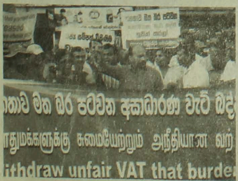
நாடலாவிய மட்டத்தில் VAT எதிர்ப்பு போராட்டங்கள்

கட்சி, நிற, இன, மத வேறுபாடின்றி நாம் அனைவரும் முகம்கொடுக்கும் வற் வரி அதிகரிக்கப்பட்ட பிரச்சினைக்கு முகம்கொடுத்துள்ளோம். இதற்கு எதிராக புத்திஜீவிகள், கல்விமான்கள் உட்பட பல தரப்பினர் போராட்டத்தில் குதித்துள்ளார்கள். ரணில்-மைத்திரி அரசு அந்தியான முறையில் மக்கள் மீது சுமத்தப்பட்ட வற் வரிக்கு எதிராக