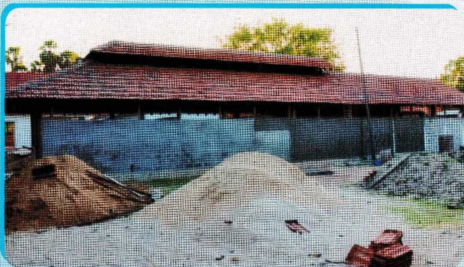
புனரமைக்கப்பட்ட சகமயலறை மண்டபம்