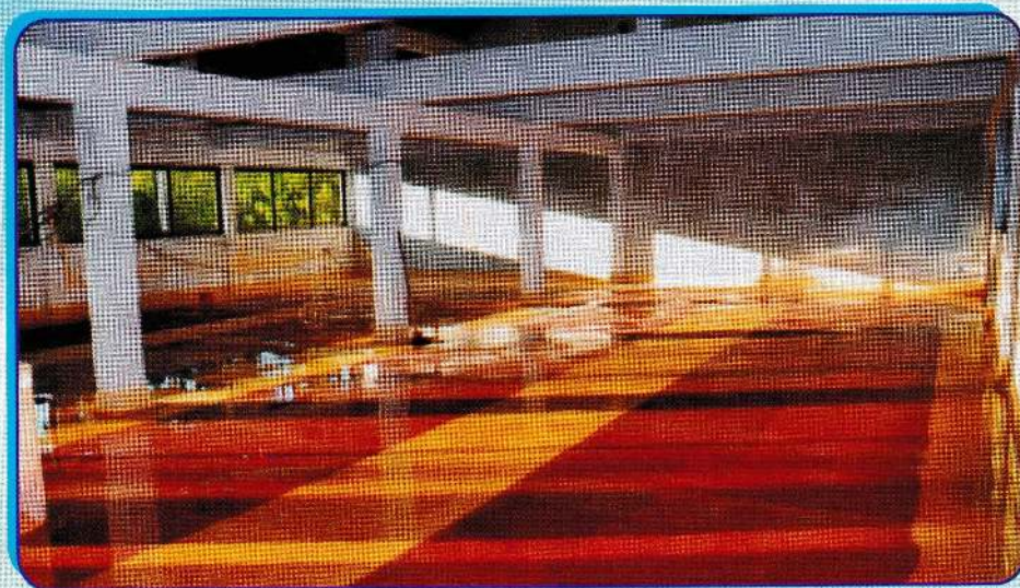
மண்டபத்தின் உட்புறத் தோற்றம்