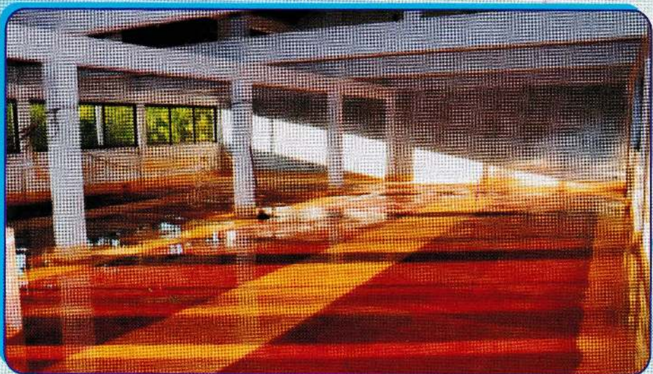
மண்டபத்தின் உட்புறத் தோற்றம்