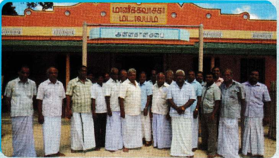
செயற்குழு கூட்டத்தின் போது உறுப்பினர்கள் 2011 - 2012