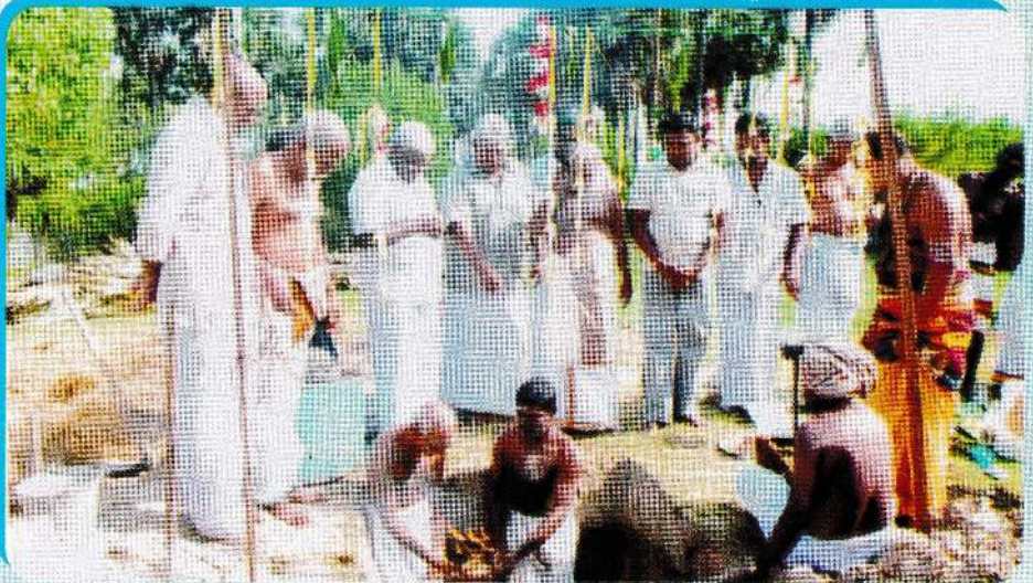
புதிய மண்டப அடிக்கல் நிகழ்வின் போது 27.01.2013