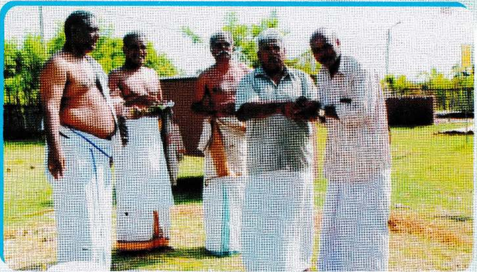
புதிய மண்டப அடிக்கல் நிகழ்வின் போது 27.01.2013