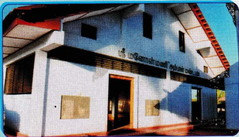
புதிய மண்டபத்தின் அழகுமிகு தோற்றம்