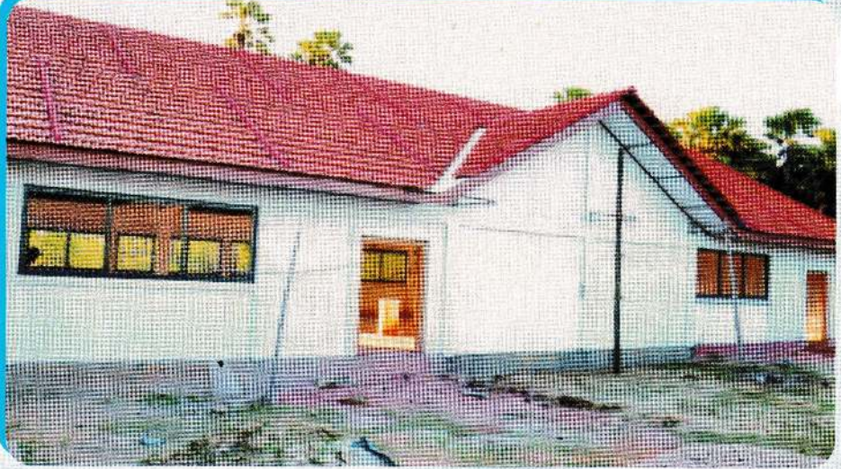
மண்டபத்தின் கிறிஸ்துப்பிறந்த் தோற்றம்