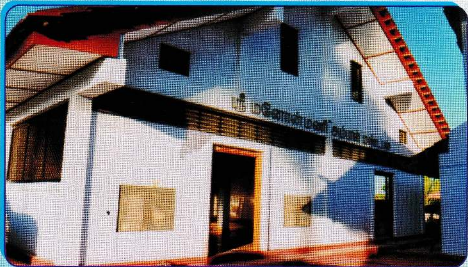
புதிய மண்டபத்தின் அடித்தளம் தோற்றம்