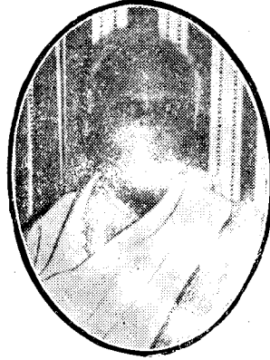
"இணைந்த கரங்களை இணைத்த கரங்கள்"

மக்களை அமைப்புருவாக்கி அவர்களின் உரிமைப் போராட்டங்களை நடத்துகிற அதேவேளை, அவர்களிடையே கருத்தரங்குகள், கலைகள் மூலம் விழிப்புணர்வு ஏற்படுத்தவும், வீடமைப்பு, கல்வி மற்றும் எழுத்தறிவு, சுகாதாரம் சுற்றுச்சூழல் ஆகியவற்றின் அபிவிருத்திக்கு பாடுபடுவதும் இம் மன்றத்தின் பணிகள்.