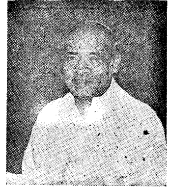
பிரதமர் திரு. நரசிம்மராவ்

அடையாளம் காண்பது இயலாது ஏனெனில், மறுவாழ்வு உதவிகள் பெறுவதற்காக இவற்றை அரசு அதிகாரிகளிடம் ஒப்படைத்திருப்பார்கள். அத்துடன் தாயகம் திரும்பி பல ஆண்டுகள் ஆன பின்னரும் இப்பயண ஆவணங்களை கைவசம் வைத்திருப்பார்கள் என்று எதிர்பார்க்க முடியாது.