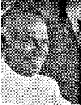
தி. சௌ. தொண்டமான்

இலங்கை அமைச்சரும் இலங்கைவாழ் இந்தியத் தமிழர்களின் பிரதிநிதியுமான திரு. எஸ். தொண்டமான் கடந்த செப்டம்பர் மாதம் இந்தியப் பிரதமர் திரு. நரசிம்மராவ் அவர்களை சந்தித்து தாயகம் திரும்பியோர் பற்றி பேச்சு நடத்தினார். அதில் பின் வருவன பற்றிப் பேசப்பட்டது.