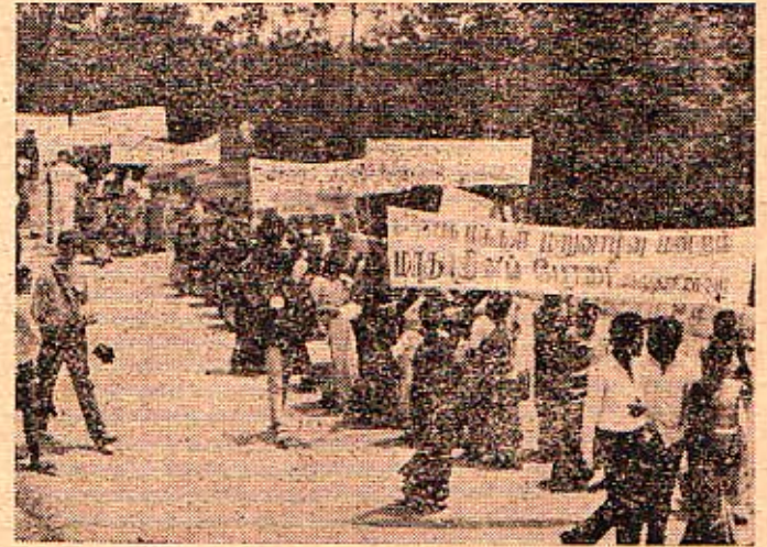
கோத்தகிரி வீதியில் மாதர்கள் அணிவகுத்து செல்லும் காட்சி

3. நீலகிரி மாவட்டத்தில் படிப்படியாக தாயகம் திரும்பியோருக்கு மறுவாழ்வு உரிமைகள் மறுக்கப்பட்டு வருகின்றன. இதனை வன்மையாக இப்பேரணி கண்டிக்கிறது. ஏனைய மக்களைப் போன்றே குடிவாழ்வு உரிமைகள் நாடு திரும்பிய மக்களுக்கு வழங்கப்படவேண்டும் என அரசையும்