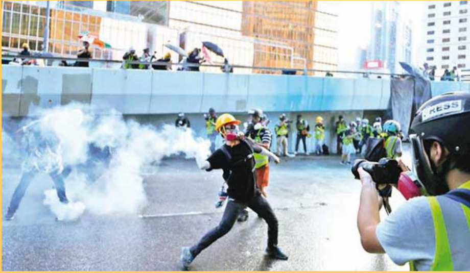
ஹொங்கொங், செப். 17 ஹொங்கொங்கை சீனாவிடம் இருந்து மீட்க இங்கிலாந்து உதவ வேண்டும் என்பதை வலியுறுத்தி