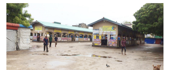
கொழும்பு, செப். 17 இலங்கை போக்குவரத்துச் சபை உறுதியாளர்களின் சம்பள உயர்வுக் கோரிக்கை தொடர் பக்கம் 02 >>>