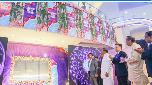
கொழும்பு, செப். 17 கொழும்பு நகரை அலங்கரிக்கும் வகையிலும் இலங்கையை ஒரு பாரிய தொலைத்தொடர்பு பக்கம் 02 >>>