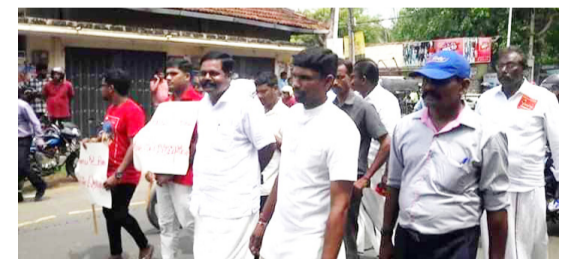
யாழ்ப்பாணம், செப். 17 யாழ்ப்பாணத்தில் நேற்று நடைபெற்ற எழுக தமிழ் பேரணியில் தமிழ்த் தேசிய பக்கம் 03 >>>