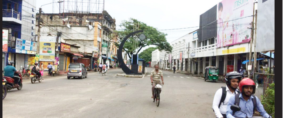
யாழ்ப்பாணம், செப். 17

தமிழ் மக்களின் பிரச்சினைகளுக்கான தீர்வை வலியுறுத்தியும், தமிழ் மக்கள் எதிர்கொள்ளும் பிரச்சினைகளை சர்வதேசத்துக்கு வெளிப்படுத்தும் வகையிலும், யாழ்ப்பாணத்தில் நேற்று முற்பகல் எழுக தமிழ் பேரணி பக்கம் 05 >>>