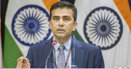
புதுடில்லி, செப். 17 பாகிஸ்தான் இந்த ஆண்டு இதுவரை 2,050 முறை சண்டை நிறுத்தத்தை மீறி நடத்தி உள்ள தாக்குதல்களில் 21 இந்தியர்கள் பலியாகி உள்ளனர் என இந்திய மத்திய வெளியுறவுத்துறை செய்தித் தொடர்பாளர் குற்றம் சாட்டி உள்ளார்.

மற்றும் சர்வதேச எல்லை பகுதிகளில், 2003 ஆம் ஆண்டு காணப்பட்ட சண்டை நிறுத்த ஒப்பந்தத்தை மீறி அடாவடித் தாக்குதலில் ஈடுபடுவதை பாகிஸ்தான் வழக்கமாகக் கொண்டுள்ளது.