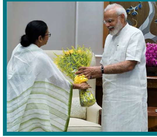
பிரதமர் மோடியை மேற்கு வங்காள முதலமைச்சர் மம்தா பானர்ஜி நேற்றுமுன் தினம் சந்தித்து பல்வேறு விவகாரங்கள் குறித்து ஆலோசனை நடத்தினார்.

'ஒரே நாடு, ஒரே மொழி', 'ஒரே நாடு, ஒரே தேர்தல்' போன்ற உள்துறை அமைச்சர் அமித்ஷாவின் சமீபத்திய கருத்துகள் இந்திய