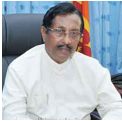
விடுதலைப்புலிகள் அமைப்பில் இருந்த 13 ஆயிரத்துக்கும் அதிக இளைஞர், யுவதிகளுக்குப் புனர்வாழ்வு அளித்து அவைகளை சமூகமயப்படுத்தும் பொறுப்பை சந்திரசிறி கஜதீர