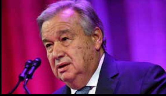
உள்ளது. இந்தக் கூட்டத் தொடரில் காஷ்மீர் விவகாரம்,

இந்தநிலையில் ஜ.நா. சபையின் 74 ஆவது பொதுச்சபைக் கூட்டம் நியூயோர்க்கில் வரும் 24 ஆம் திகதி தொடங்கி 30 ஆம் திகதி வரை நடக்க