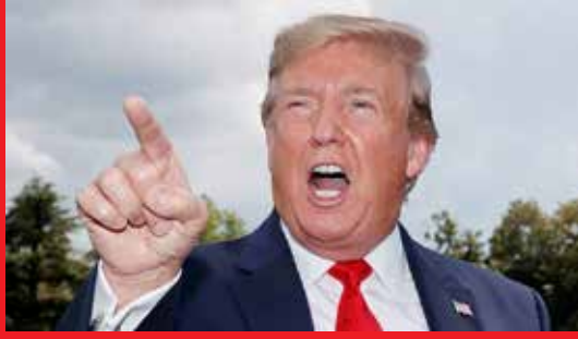
அதற்கு பழிக்குப்பழியாக 11 ஆயிரம் கோடி டொலர் மதிப்பிலான அமெரிக்கப் பொருள்களுக்கு சீனா வரிவிதித்தது.

சீனா - அமெரிக்கா இடையே இன்னும் வர்த்தக ஒப்பந்தம் எட்டப்படாததால் இரு நாடுகளும் மாறி மாறி வர்த்தகத்தில் பழிதீர்த்து வருகின்றன. 25 ஆயிரம் கோடி டொலர் மதிப்பிலான சீனப் பொருள்களுக்கு அமெரிக்கா கூடுதல் வரி விதித்தது.