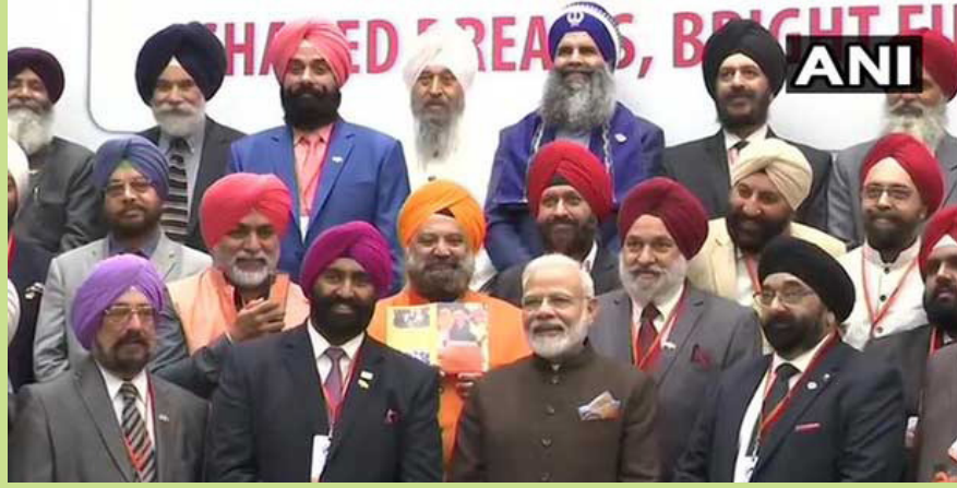
தில் பிரதமர் மோடி பேசினார். இதையடுத்து, ஹூஸ்டன் நகரில் பிரதமர் மோடியை சீக்கிய சமூகத்தினர்

முதல் கூட்டமாக, ஹூஸ்டனில் நடந்த எரிசக்தி மற்றும் எண்ணெய் நிறுவன தலைவர்கள் கலந்துகொண்ட கூட்டத்