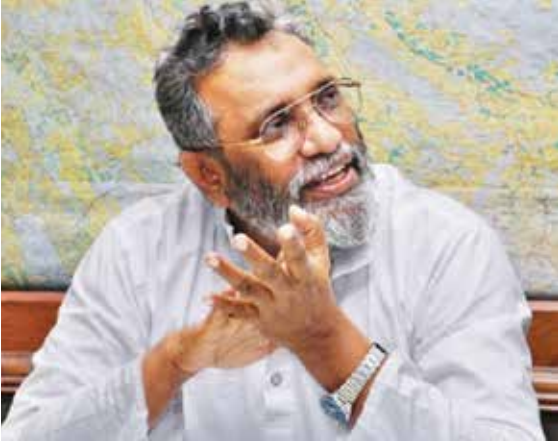
கொழும்பு, ஒக். 03