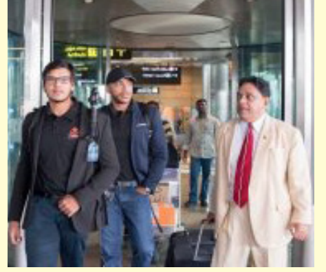
கொழும்பு, ஒக். 03