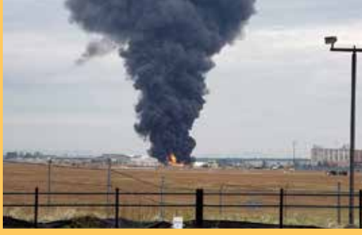
ஒரு சில நிமிடங்களில் திடீரென தரை

யிறங்க முயற்சித்துள்ளது. இதில் விமானம் விபத்திற்குள்ளாகி பிராட்லி சர்வதேச விமானத்தில் இருந்த பராமரிப்பு மையம் ஒன்றில் மோதியது.