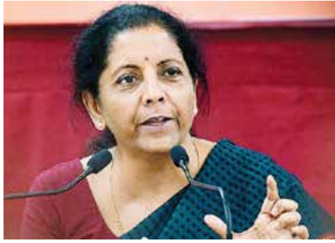
இந்தியா விருப்பத்திற்குரிய நாடாக இருக்கிறது என்பதை

வொஷிங்டன் டிசியில் செய்தி யாளர்களிடம் பேசிய அவர், சீனாவில் இருந்து வெளியேறி மற்ற நாடுகளில் முதலீடு செய்ய விரும்பும் பன்னாட்டு நிறுவனங்கள், நிச்சயம் இந்தியாவைப் பரிசீலிக்கும் என்றார்.