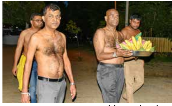
யாழ்ப்பாணம், ஒக். 31 ஜனாதிபதி வேட்பாளரும், முன்னாள் இராணுவத் தளபதியுமான ஜெனரல் மகேஷ் பக்கம் 03 >>>