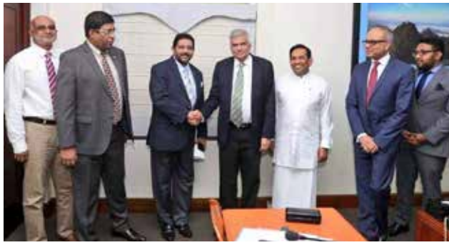
ஆதரிக்க முடிவு செய்தோம். ஐ.தே.க. தலைவரைச் சந்தித்து எங்கள் செய்தியை தெரிவித்தோம்.

பள்ளிவாசல்களில் வாள்கள் இருப்பதாகவும் மதரஸாக்கள் சோதனை செய்யப்படும் என்று கூறும் - சிறுபான்மைச் சமூகங்கள் அழிக்கப்படவேண்டும் என்று தொடர்ந்து கூறும் - மஹிந்த ராஜபக்ஷவை ஆதரிக்க முடியாது. எனவே ஒருமனதாக சஜித் பிரேமதாஸவை