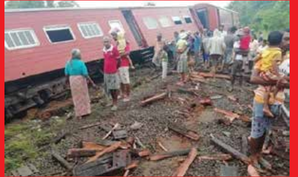
களை மக்கள் மீண்டும் விரைவாகப் பெற்றுக் கொள்ள முடியுமெனவும் ரயில்வே திணைக்கள அதிகாரிகள் தெரிவித்துள்ளனர். (ஐ)

அதனைத் தீர்த்தும் பணிகள் முன்னெடுக்கப்பட்டுள்ளமையினால் ரயில் சேவை