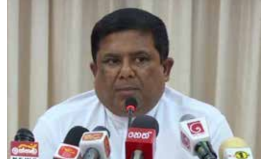
வித சிக்கலும் கிடையாது. அந்தவகையில் நாட்டின் பாதுகாப்புடன் தொடர்புடைய ஒருவருக்கு நாம் உரிய கௌவரத்தையும் மரியாதையையும் வழங்க முடியுமே தவிர நாட்டை ஒப்படைக்க முடியாது - என்றார்.

இதன்போது பீல்ட் மார்ஷல் சரத் பொன்சேகா ஆற்றிய சேவையை எம்மால் ஒருபோதும் மறக்க முடியாது. எனவே சஜித் அரசில் அவர் பாதுகாப்பு அமைச்சராகச் செயற்படுவதில் எவ்