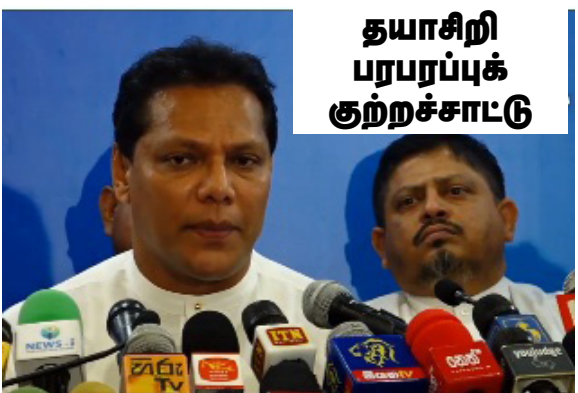
தயாசிரி பரபரப்புக் குற்றச்சாட்டு

கொழும்பு, ஒக். 23 ஸ்ரீலங்கா சுதந்திரக்கட்சி இன்று மூன்றாம் நிலைக்கு தள்ளப்பட்டுள்ளமைக்குக் கட்சியின் முன்னாள் தலைவரான சந்திரிகா பண்டாரநாயக்க குமாரதுங்கவும் பொறுப்புக் கூறவேண்டும் என்று ஸ்ரீலங்கா சுதந்திரக்கட்சியின் பொதுச்செயலாளர் தயாசிரி ஜயசேகர தெரிவித்தார். சுதந்திரக்கட்சி தலைமையகத்தில் நேற்று நடைபெற்ற