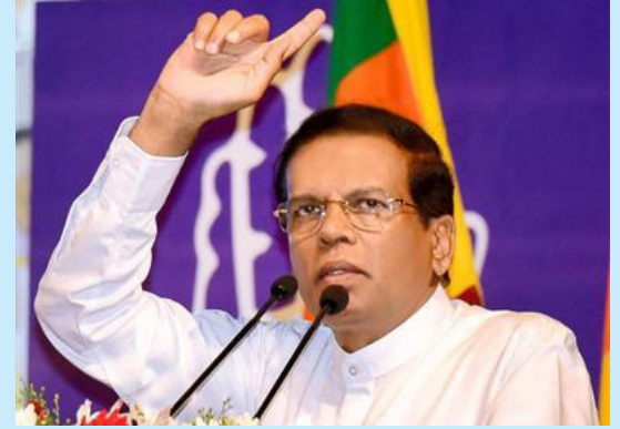
பெறும் முறைக்கேடுகள் நாட்டை பாரிய பொருளாதார வீழ்ச்சிக்கு இட்டுச் சென்றுள்ளன எனவும் ஜனாதிபதி இதன்போது சுட்டிக்காட்டினார். (ஐ)

கொழும்பு, நவ. 10 மின்சார சபையை இருளில் இருந்து மீட்பதற்கு உடனடி நடவடிக்கை எடுக்கப்படவேண்டுமென ஜனாதிபதி மைத்திரிபால சிறிசேன தெரிவித்துள்ளார். கொழும்பில் நேற்றுமுன்தினம் இடம்பெற்ற நிகழ்வொன்றில் கலந்துகொண்டு கருத்து வெளியிடும் போதே அவர் இவ்வாறு குறிப்பிட்டார். மின்சார சபையினால் இந்த ஆண்டு 8900 கோடி ரூபா நட்டம் ஏற்பட்டுள்ளதாகவும் அவர் இதன்போது சுட்டிக்காட்டினார். மின்சார சபையில் ஏற்பட்டிருக்கும் இந்த பாரிய நெருக்கடி தொடர்பான பொறுப்பில் இருந்து பொதுப் பயன்பாட்டு ஆணைக்குழு விலகிக்கொள்ள முடியாதெனவும் ஜனாதிபதி இதன்போது குறிப்பிட்டார். நீர்வழங்கல், பெற்றோலியம் மற்றும் இலங்கை விமான சேவை ஆகிய நிறுவனங்களில் இடம்