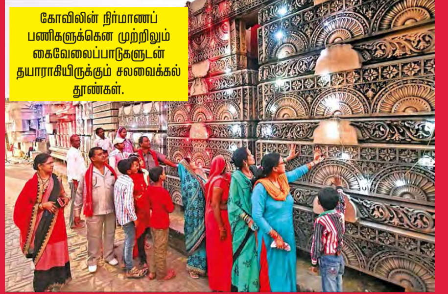
கோவிலின் நிர்மாணப் பணிகளுக்கென முற்றிலும் கைவேலைப்பாடுகளுடன் தயாராகியிருக்கும் சலவைக்கல் தூண்கள்.

புதுடெல்லி, நவ.12 அயோத்தி ஸ்ரீராம ஜென்ம பூமியில் சர்ச்சைக் குரிய நிலம் தொடர்பாகக் கடந்த சனியன்று இந்திய உச்சநீதிமன்றம் சனியன்று வழங்கிய தீர்ப்பைத் தொடர்ந்து, இந்து, முஸ்லிம் தலைவர்களுடன் மத்திய அரசு நேற்று முன்தினம் அவசர ஆலோசனை நடத்தியது. அயோத்தியில் ராமர் கோவில் கட்டுவதற்கான பணிகள் வருகிற ஏப்ரல் மாதம் தொடங்கும் என எதிர்பார்க்கப்படுகிறது.