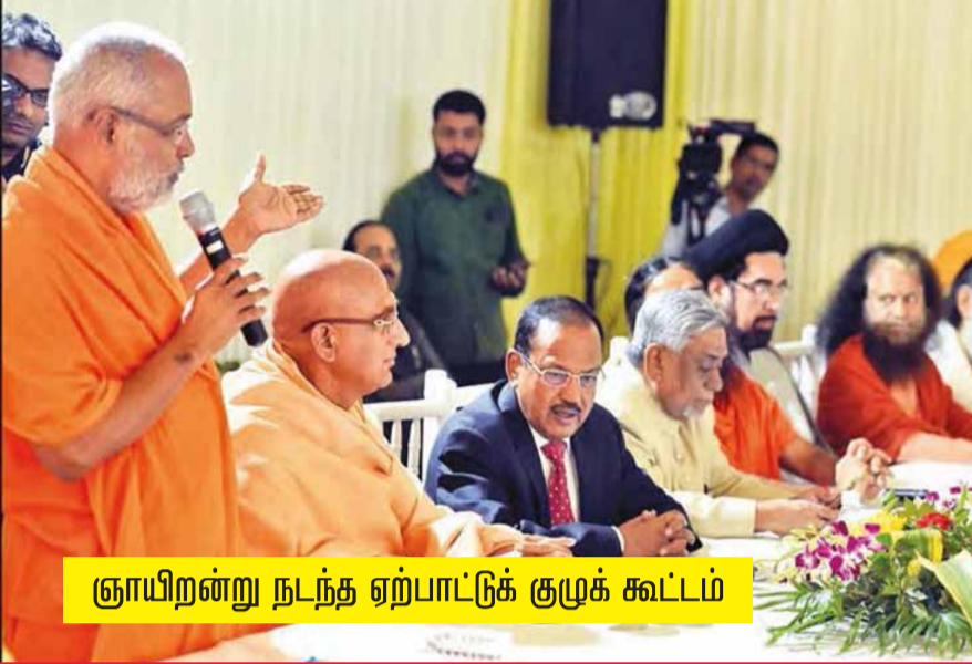
ஞாயிறன்று நடந்த ஏற்பாட்டுக் குழுக் கூட்டம்