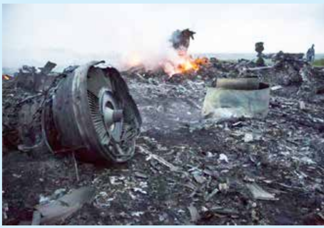
கட்டுப்பாட்டு அறையுடனான தொடர்பை இழந்தது. அந்த விமானம் கடலில்

ஆம்ஸ்டர்டாம், நவ.17 2014 ஆம் ஆண்டு 298 பேரை பலிகொண்ட விமான அழிவுச் சம்பவத்தில், மலேசிய விமானத்தைச் சுட்டுவீழ்த்த ரஷ்யா கட்டளையிட்டதா என்பது குறித்த தகவல் வெளியாகி உள்ளது. நெதர்லாந்து நாட்டின் தலைநகர் ஆம்ஸ்டர்டாமில் இருந்து மலேசியன் ஏர்லைன்ஸுக்குச் சொந்தமான எம்.எச்.17 விமானம் கடந்த 2014 ஆம் ஆண்டு ஜூலை மாதம் 14 ஆம் திகதி கோலாலம்பூர் நோக்கிப் புறப்பட்டுச் சென்றது. பயணிகள் மற்றும் ஊழியர்கள் என 298 பேருடன் சென்று கொண்டிருந்த அந்த விமானம் ரயா - உக்ரைன் எல்லைக்கு அப்பால் சுமார் 50 கி.மீ தொலைவில் பறந்து கொண்டிருந்தபோது