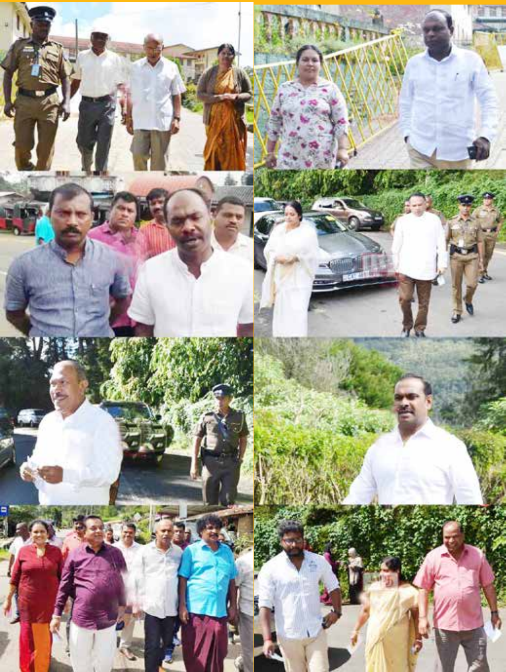
நேற்றைய ஜனாதிபதித் தேர்தலில் மலையக அரசியல் தலைவர்கள் வாக்களிக்கச் சென்ற போது எடுக்கப்பட்ட படங்கள்....