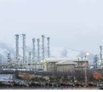
பாகிஸ்தான் ஆர்வம் காட்டி வருவதாக ஜேர்மன் அரசு தெரிவித்து உள்ளது. நாடாளுமன்ற உறுப்பினர்

பேர்லின், நவ.17 உயிரியல் மற்றும் வேதியியல் (இரசாயனவியல்), அணுசக்தி ஆயுதங்களில் பயன்படுத்தப்படும் தொழில்நுட்பத்தை சட்டவிரோதமாக வாங்க