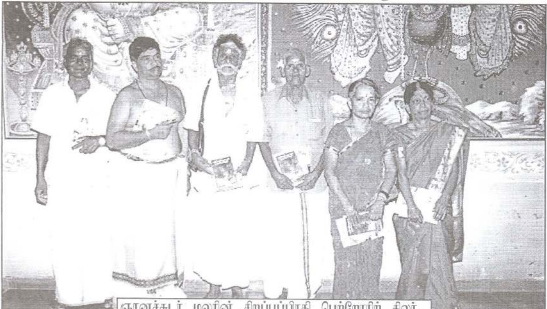
ஞானச்சுடர் மலரின் சிறப்புப்பிரதி பெற்றோரிற் சிலர்...