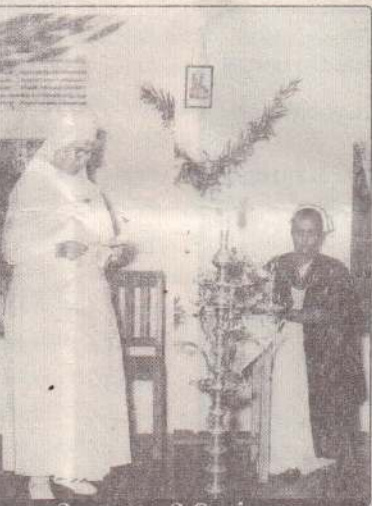
பிரதம தாதி பேன்ஹூடா அவர்கள் சிவசமஸி கன்னியர்

ணங்க ஏழு அருட்சகோதரிகளும் அனுப்பப்பட்ட பொறுப்புக்களை ஏற்கச் சென்ற விக்கிரமசிங்க அவர்களும், அவருடைய நூற்றாண்டுகள். அதேவேளை அருட்சகோதரி சிகிச்சைக் கூடத்தையும், மகப் பேற்று மயானதா என ஆராய்ந்தார்கள். தம் ஒன்று அல்லது இரண்டு விடுதி அதேவேளை அருட்சகோதரி அலோ