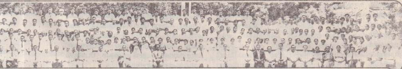
வைத்தியசாலை 1963 இல் திருச்சிலுவைத் தாதியக் கன்னியரின் பிரியாவிடையின் போது...

அருட்சகோதரி தி. ரொபினா திருச்சிலுவைக் கன்னியர்