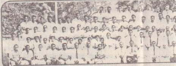
யாழ் அரச பொது வைத்தியசாலை

மாவட்டங்களிலும் யாகிஸ்தானில் ஓர் திலும் தன் கிளைகளைப் பரப்பி சேவையை ஓர் விருட்சமாகத் திகழ்கின்ற