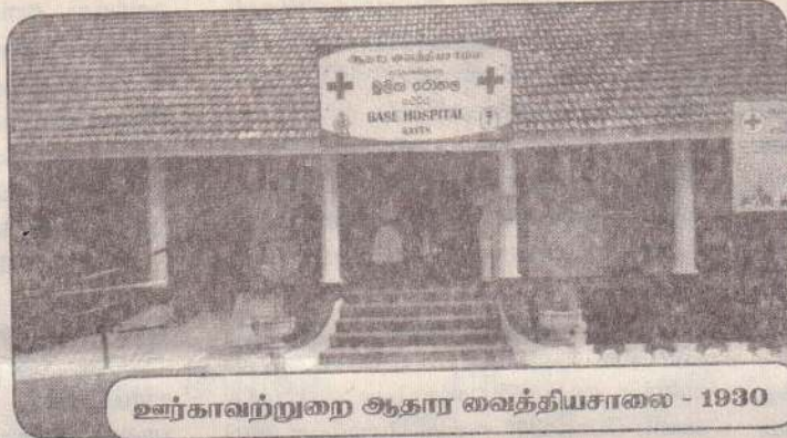
ஊர்காவந்துறை ஆதார வைத்தியசாலை - 1930

எப்போதும் எத்தேவையிலும் முன்னிற்கும் கன்னியர்களாகத் தமது சபையை நிறுவினார். எமது அருட்சகோதரிகள் தாதிச் சேவையை குயிலோன், திருவனந்தபுரம் ஆகிய இரண்டு மாவட்ட அரசாங்க வைத்தியசாலைகளில் பொறுப்பெடுத்து அதனை நிறுபித்தார்கள்.