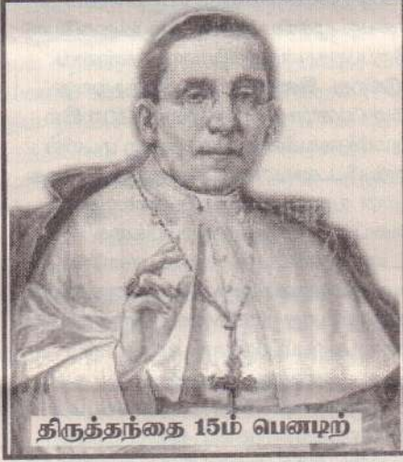
திருத்தந்தை 15ம் பெனடிற்

2019 ஆம் ஆண்டின் ஒக்ரோபர் மாதத்தை மறைபரப்புக்கான சிறப்பான மாதமாக அனுசரிக்கும் இப்புனித காலத்தின் சிறப்புக்களையும், இறையியல் சிந்தனைகளையும் தொடர்ந்துவரும் "பாதுகாவலனில்" எதிர்பார்த்திருங்கள்.