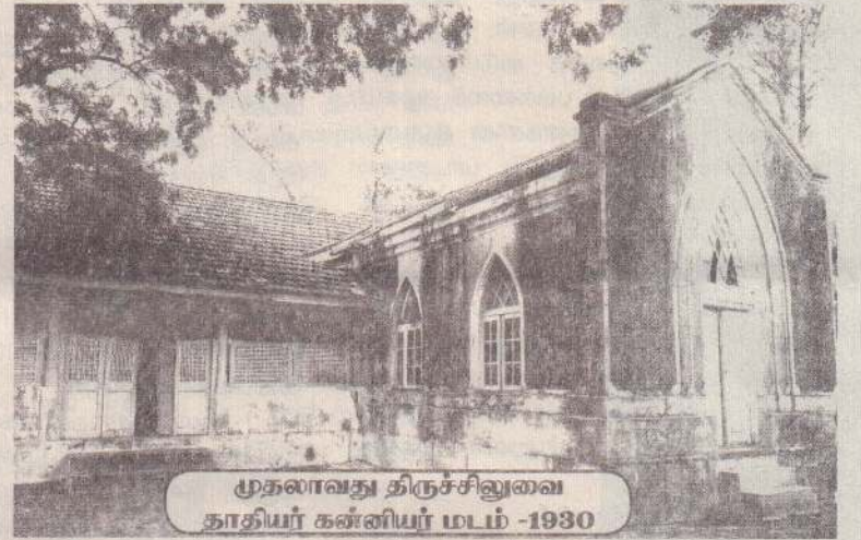
முதலாவது திருச்சிலுவை தாதியர் கன்னியர் மடம் - 1930

1962-1982 வரையான காலப்பகுதியில் மூன்று மிஷனரி சகோதரிகளும் (60 வயதிற்கு மேற்பட்டோர்) நித்திய வாக்குப்பெற்ற மூன்று இலங்கை அருட்சகோதரிகளும், 18 தற்காலிக வாக்குத்தத்த அருட்சகோதரிகளும், நான்கு நவசன்னியாசிகளும், நான்கு முதல் நிலை பயிற்சி பெறுவோரும் காணப்பட்டனர். இந்நேரத்தில் ஆரம்ப காலம் போன்று உருவாக்கல் மற்றும் தொழில்முறைப் பயிற்சியும் முக்கிய உந்துதலாக மாறியது. இளம் அருட்சகோதரிகள் தாதியர்கள், மருந்தாளர்கள் போன்ற பயிற்சிக்கு அனுப்பப்பட்டனர். இலங்கையிலுள்ள தாதிய பயிற்சி நிலையங்கள் அருட்சகோதரிகளுக்கு மூடப்பட்டதால் சகோதரிகள் பயிற்சிக்காக இந்தியாவிற்கு அனுப்பப்பட்டனர். சகோதரிகளின் எண்ணிக்கை மெதுவாக அதிகரித்தமையினால்