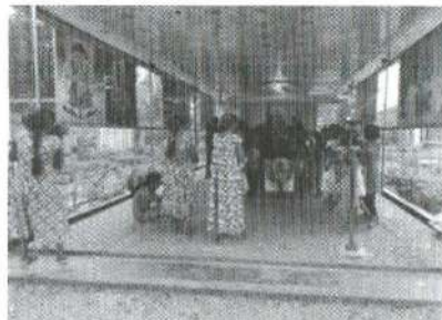
Pillaiyar Temple now

Luxmi temple is a much bigger project. The construction work is under way. As part of the construction, we have planned to build a guest house to be commercially managed by the villagers.