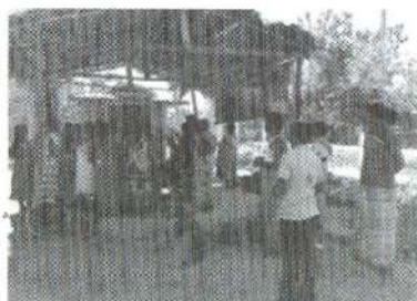
Pillaiyar Temple before

We managed to put up modern infrastructure for the Pillaiyar temple within a short space of time and devised procedures to generate income from its operations.