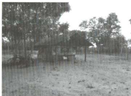
Amman Temple before

Luxmi temple is a much bigger project. The construction work is under way. As part of the construction, we have planned to build a guest house to be commercially managed by the villagers.