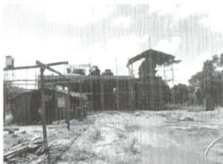
Amman Temple under construction