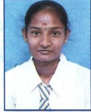
அ.ஜனுஷா தரம் 13 திறனாய்வுப் போட்டி