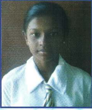
ஜோ.தர்க்காழீ பிரிவு 02 தனி இசை 2ம் இடம்