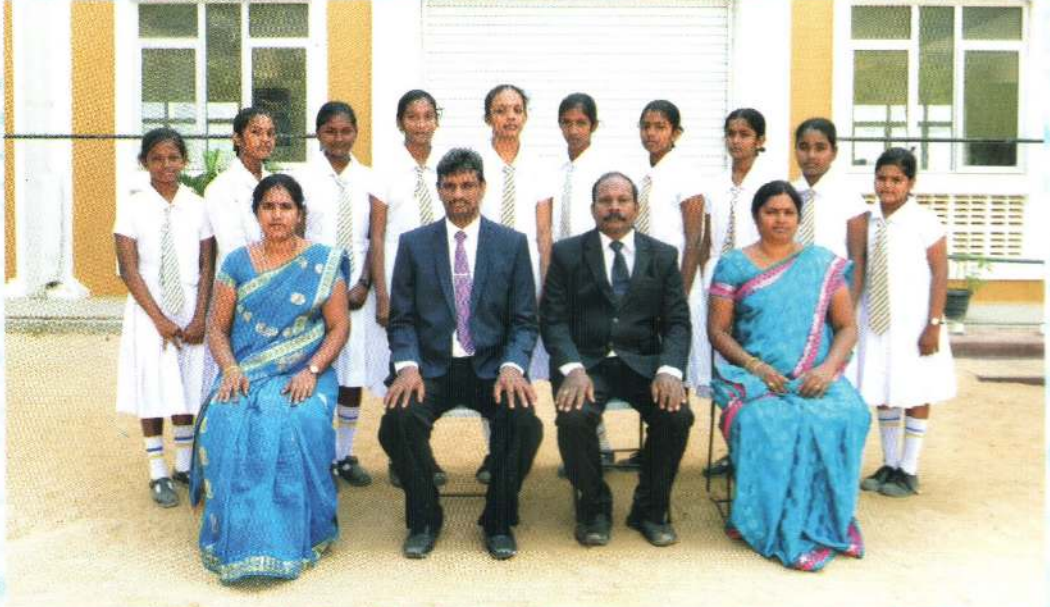
பிரிவு 01 3ம் இடம்