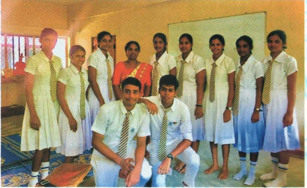
பிரிவு 02 2ம் இடம்