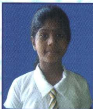
ச.ஜிஸ்ணுகா தரம் 7 3 ஆம் இடம்