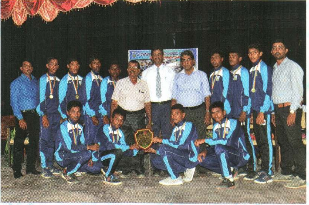
முதலாம் இடம் - தங்கப் பதக்கம்