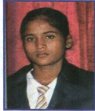
நே.டக்கிஷிதா கோலூன்றிப் பாய்தல் 1ம் இடம் தங்கப்பதக்கம்