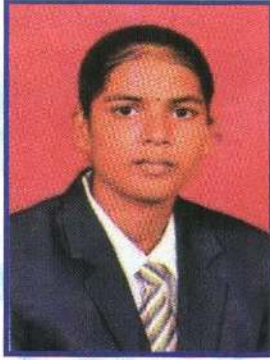
பா.கிரிஜா கோலூன்றிப் பாய்தல் 2ம் இடம் வெள்ளிப்பதக்கம்