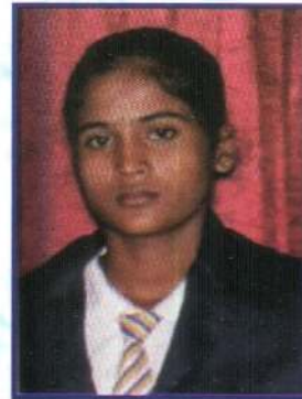
ந.டக்ஷிதா தடைதாண்டல் 3ம் இடம்