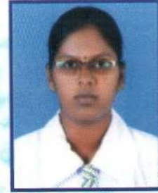
ம.நிதர்சனா தரம் 12 2ம் இடம்