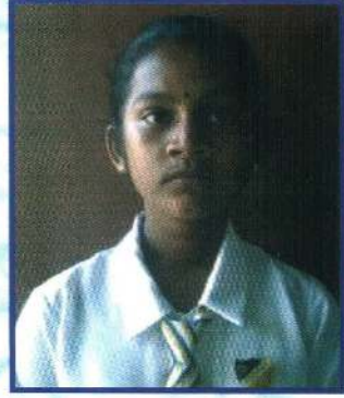
ஸ்ரீ.சாகரா பிரிவு 03 தனி இசை 2ம் இடம்