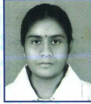
பு.வைசாலி குறுநாடகவாக்கம் பிரிவு 04 2ம் இடம்